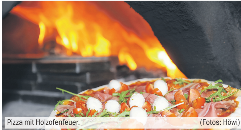
Pizza mit Holzofenfeuer.