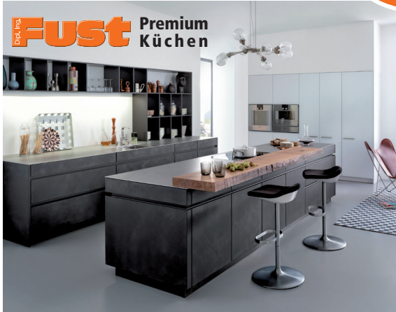
CONCRETE - Beton, das bevorzugte Baumaterial moderner Architektur, entfaltet auch in der Küche seine puristische Ästhetik.