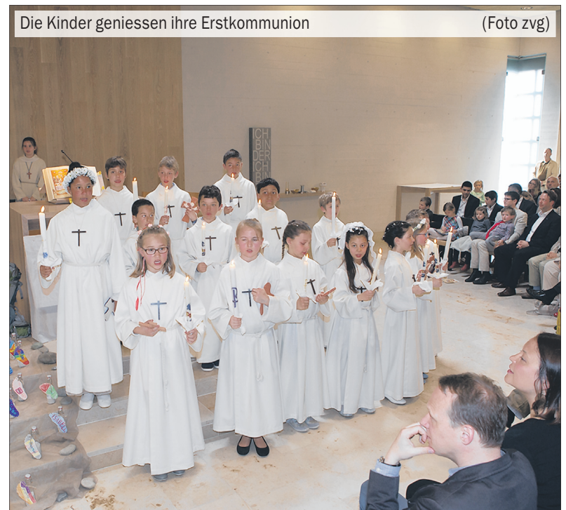
Die Kinder geniessen ihre Erstkommunion

Die mit Begeisterung gesungenen Lieder der «Illgauer Kindermesse», die Erzählung «Spuren im Sand», das gespielte Evangelium von den Emmausjüngern und natürlich der Empfang der heiligen Kommunion werden den 29 Erstkommunionkindern hoffentlich in