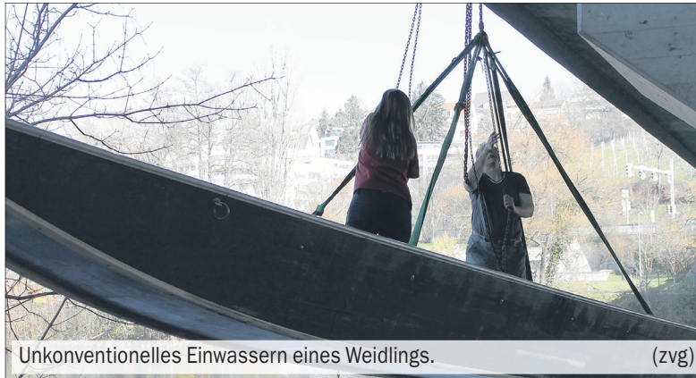
Unkonventionelles Einwassern eines Weidlings.

Als die Weidlinge ins Wasser kamen, war die Freude natürlich gross: Die wöchentlichen Trainings auf dem Wasser werden wieder stattfinden. Doch bevor es richtig losgeht, müssen sich die Pontoniere noch stärken: Bei ei-