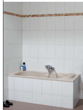
Die Badewanne ohne Duschlösung: Die muss jetzt raus!

Im Klartext: Dusche UND Badewanne in einem – auf Derselben Fläche, ohne mehr Platzbedarf.