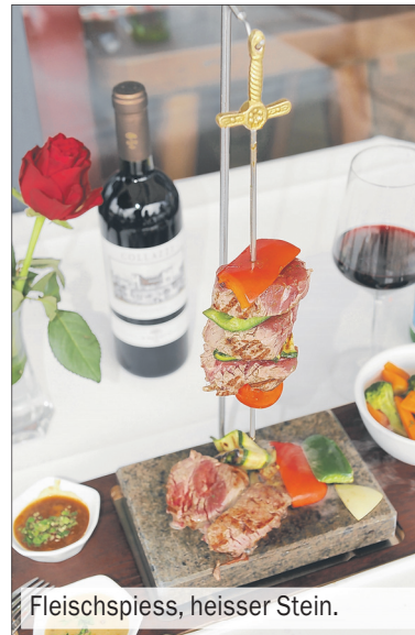
Fleischspieß, heisser Stein.