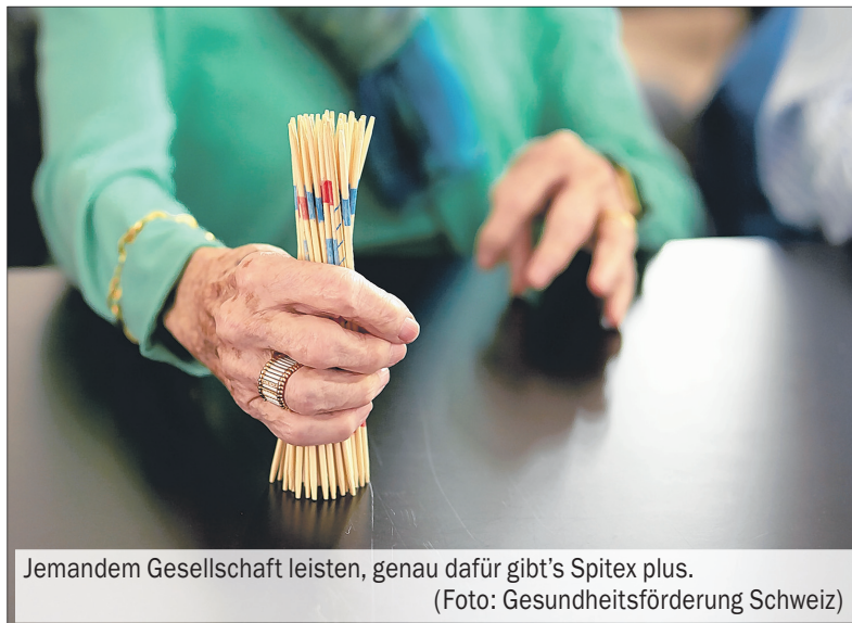
Jemandem Gesellschaft leisten, genau dafür gibt's Spitex plus.

Zu diesem Angebot gehören beispielsweise das Begleiten von älteren Menschen an Ausstellungen und Anlässe oder verschiedenste Formen von Gesellschaftsleistungen wie Spielen, Vorlesen oder Gespräche führen. Doch