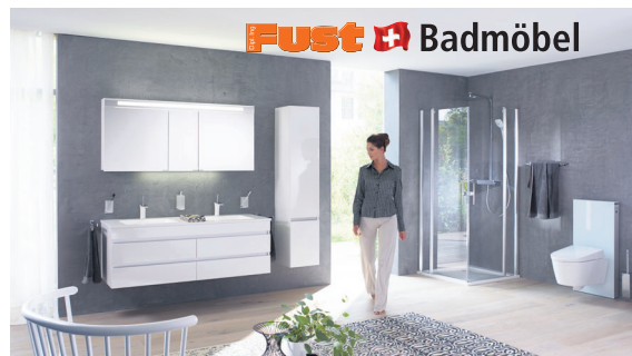
Mara - Aus der Schweiz für die Schweiz. In Lütisburg, im malerischen Toggenburg im Kanton St.Gallen, entsteht Ihr Fust Badmöbel in bester Schweizer Qualität. Hier werden die hochwertigen Produkte unter strengsten Anforderungen hergestellt – Made in Switzerland.

Jubiläumspreis* nur Fr. 4 940.- Vorher Fr. 5 490.- Sie sparen Fr. 550.-