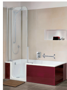
Die neue Dusche und Badewanne in einem ist fertig.

Heimberatung – nutzen Sie unseren kostenlosen und unverbindlichen Kundenservice Wir kommen zu Ihnen nach Hause und planen Ihre Küche oder Ihr Bad dort, wo es später auch stehen soll. So können Sie sicher sein, dass auch alles genau passt. Die Küchen- oder Badberatung ist natürlich kostenlos.