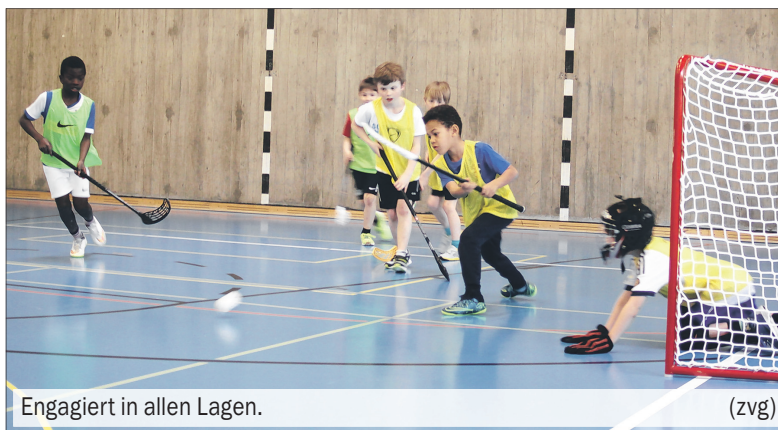
Engagiert in allen Lagen.

Werden sich ausreichend viele Schüler anmelden? Können genügend Naturalspenden für die Verpflegung der Kids gesammelt werden? Melden sich genug Helfer, die als Schiedsrichter, Security- oder Sanitäts-Personal fungieren? Diese und ähnliche Fragen stellten sich den Organisatoren des Unihockey-Turniers im Vorfeld. Doch die Sorgen waren unbegründet, ging doch das erste vom Elternrat der Schule Vogtsrain veranstaltete Unihockey-Turnier am 1. April höchst erfolgreich über die Bühne! Es meldeten sich 39 Schülerinnen und Schüler an, die auf acht Mannschaften für zwei Turniere aufgeteilt wurden. Dabei wurde so vorgegangen, dass die einzelnen Mannschaften aus Kindern aller drei Jahrgänge zusammengelöst wurden, je nach Stufe.