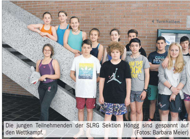
Die jungen Teilnehmenden der SLRG Sektion Höngg sind gespannt auf den Wettkampf.

An der Jugendregionalmeisterschaft werden jeweils in Viererteams vier Disziplinen absolviert. Diese sind an verschiedene Elemente des Rettungsschwimmens angelehnt: das Transportieren eines Kameraden, der nicht mehr schwimmen kann; das Tau-