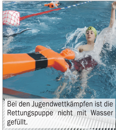
Bei den Jugendwettkämpfen ist die Rettungspuppe nicht mit Wasser gefüllt.