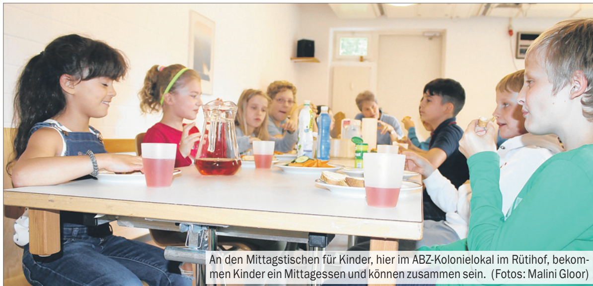
An den Mittagstischen für Kinder, hier im ABZ-Kolonielokal im Rütihof, bekommen Kinder ein Mittagessen und können zusammen sein.

Am Mittagstisch des Frauenvereins Höngg kümmern sich zwei Betreuerinnen um die Schülerinnen und Schüler und sorgen dafür, dass diese sich nicht nur gesund verpflegen, sondern auch spielen oder Hausaufgaben erledigen können.