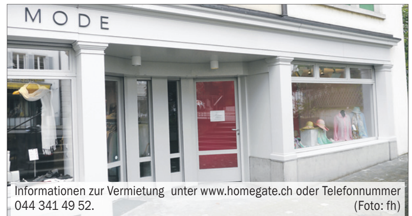
Informationen zur Vermietung unter www.homegate.ch oder Telefonnummer 044 341 49 52.

Für wie lange, ist ungewiss, denn abgesehen von Schnellimbisslokalen und anderen Firmen, die nicht in dieses Haus passen, habe sich noch niemand für die Lokalität interessiert, gab die Vermiete-