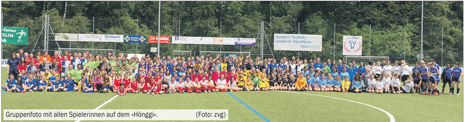
Gruppenfoto mit allen Spielerinnen auf dem «Hönggi».

Bereits zum zweiten Mal fand am letzten Samstag das grosse Zürcher Juniorinnenturnier auf der Sportanlage Hönggerberg statt. Das Turnier wurde durch den Fussballverband des Kantons Zürich in Zusammenarbeit mit dem Sportverein Höngg organisiert.