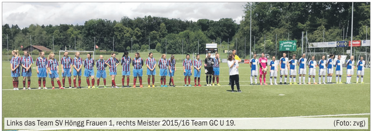
Links das Team SV Höngg Frauen 1, rechts Meister 2015/16 Team GC U 19.

Das «Girls Wanted»-Team spielte zwar ausser Konkurrenz mit, aber nicht mit weniger Begeisterung. Es konnte dabei einiges an Erfahrung sammeln und von den schon etwas erfahreneren Fussballerinnen lernen. Am Ende der Turniere erhielt selbstverständlich jede Spielerin, egal ob Fussballerin oder Nichtfussballerin, einen Preis.