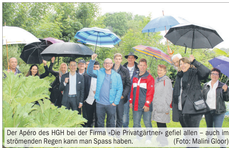
Der Apéro des HGH bei der Firma «Die Privatgärtner» gefiel allen – auch im strömenden Regen kann man Spass haben.

Getränke und Snacks werden vom Verein gesponsert, die jeweili-