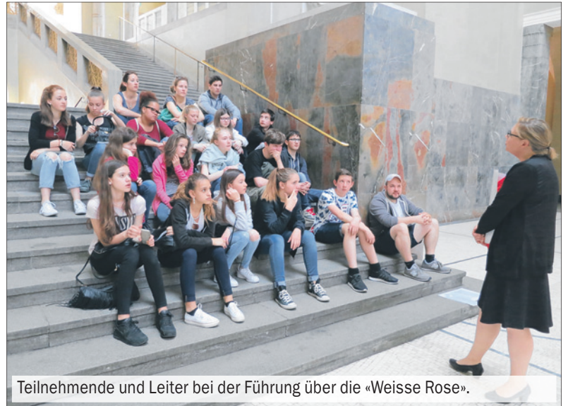
Teilnehmende und Leiter bei der Führung über die «Weisse Rose».

Am Nachmittag stand die Besichtigung der Bavaria Filmstudios auf dem Programm. Dort wurden schon so manche Filme produziert, wie beispielsweise «Der Schuh des Manitu» oder auch Teile von «Das Boot».