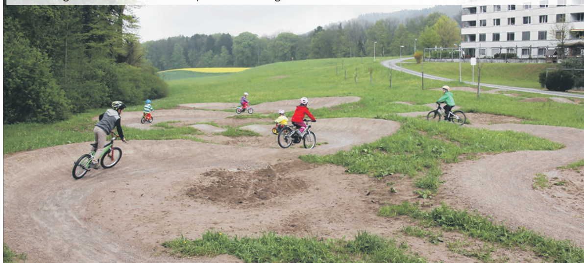
Die Kinder geniessen ihren neuen Velopark in vollen Zügen.

ne mit seiner Vespa verspätete, hielten es die Kinder nicht mehr aus und fuhren schon vor der offiziellen Eröffnung ihre Runden im neuen Bikepark. Als der Stadtrat dann eintraf, fanden sie sich jedoch schnell wieder ganz brav an der Startlinie ein, wo sie zusammen mit dem sichtlich begeisterten Filippo Leutenegger zusammen das rote Band mit Scheren durchschneiden durften. Leutenegger nahm in seiner Ansprache lächelnd Rücksicht auf die zap-