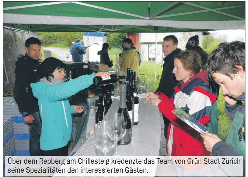
Über dem Rebberg am Chillesteig kredenzte das Team von Grün Stadt Zürich seine Spezialitäten den interessierten Gästen.

Dann auf das Fahrrad geschwungen – ja, wer alle vier Höngger Veranstaltungsorte besuchen will und korrekt degustiert, ist mobil gut bedient – und ab in den Rebberg am Chillesteig. Dort warteten