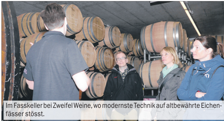
Im Fasskeller bei Zweifel Weine, wo modernste Technik auf altbewährte Eichenfässer stösst.

Tatsächlich, unterdessen hatte der Regen aufgehört. Kalt aber blieb es, und dagegen sind so ein paar Pedalumkehrungen hin zum Obsthau Wegmann im Franken-