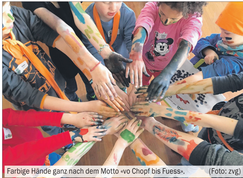
Farbige Hände ganz nach dem Motto «vo Chopf bis Fuess».

Was sich auf Papier machen lässt, konnte man mit Körperfarben auch an sich selbst ausprobieren. Manche malten schöne Muster auf Arme und Beine, andere verwandelten ihr Gesicht in ein «Büsi» und wiederum andere bestrichen Arme, Hände und Beine grossflächig mit neuer Farbe – gemäss dem Motto «vo Chopf bis Fuess». Zu kleinen und grossen Künstlern wurden die Kinder am letzten Tag. Ausgehend von ihrem eingefärbten Handabdruck, gestalteten sie die unterschiedlichsten Tiere und Figuren auf einem quadratischen Leinwandbild, das