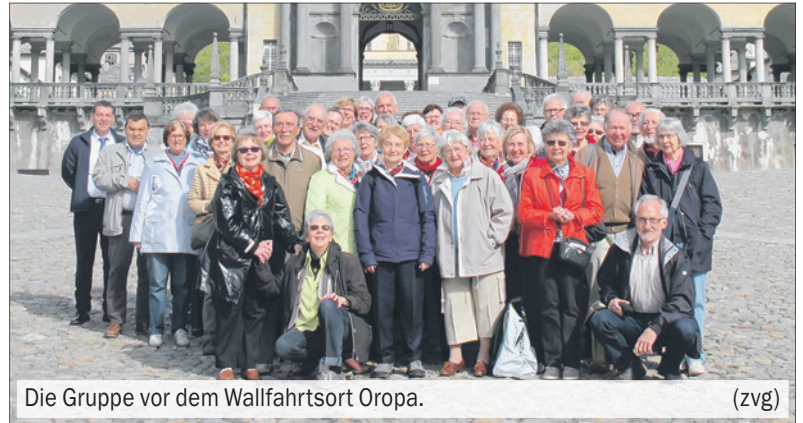
Die Gruppe vor dem Wallfahrtsort Oropa.

Auf der Fahrt zur Sacra di San Michele, einer Gottesburg aus dem 12. Jahrhundert, wurde die Strasse immer schmaler und kurviger und liess den Chauffeur an einer sicheren Ankunft auf dem Berg zweifeln, zumal immer mehr Schnee die Strasse säumte. Die