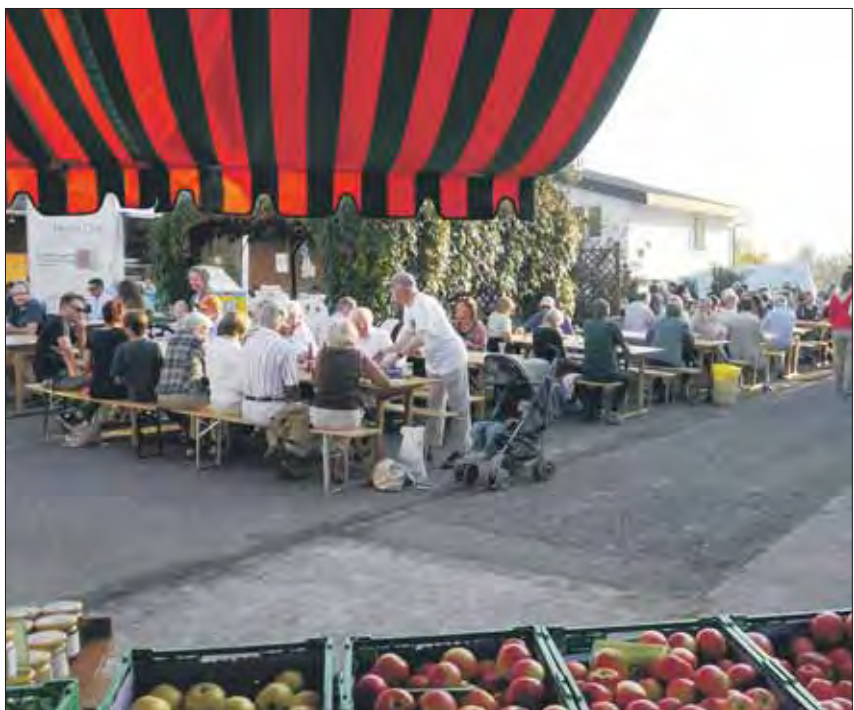
Ein Bauernhof voller Festbänke.