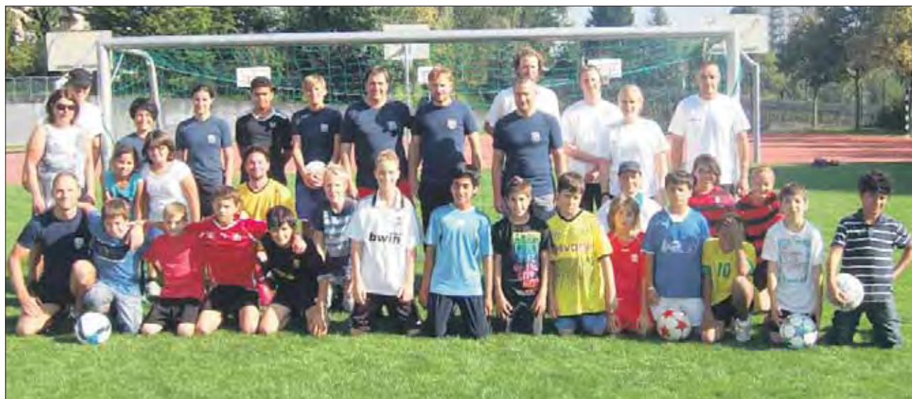
So kann Fussball zwischen Jugendlichen und Polizisten auch sein: friedlich und fair im Rütihof.