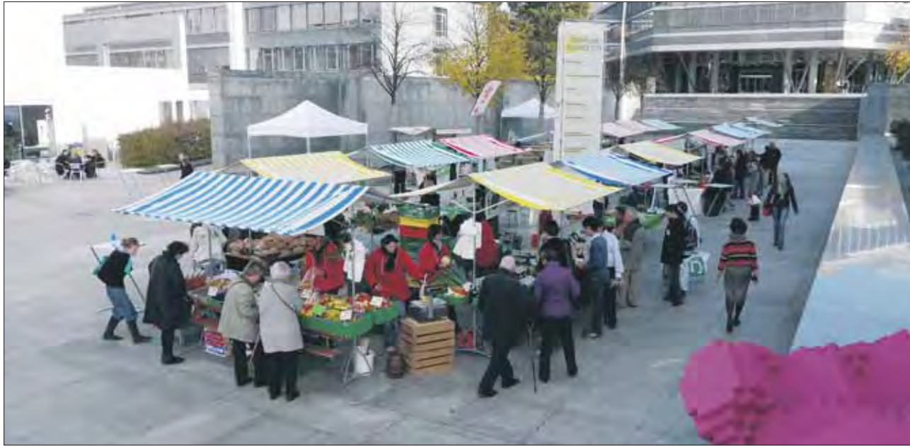
Marktstimmung letzten Oktober auf dem Campus.