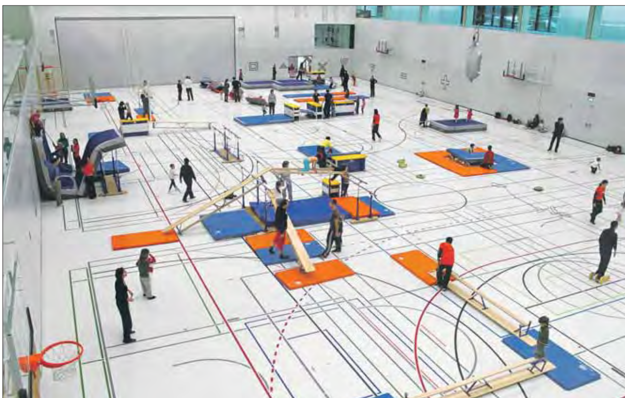
Blick in die Halle: Viel Platz für viel Bewegung in der Sporthalle von Science City der ETH Hönggerberg.

In der Sporthalle kann es dann losgehen: Unter dem Motto «Spielend lernen» wurden Parcours, Matten, Barren, Sprossenwände und was es sonst noch im Fundus eines Geräteraumes gibt, so aufgestellt, dass die Kleinen – und die Grossen! – im Spiel ihre Grenzen austesten und ih-