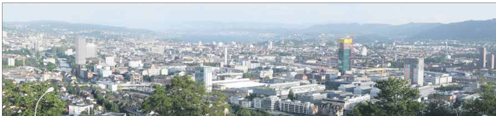
Panoramasicht von der Waid aus auf die Silhouette der Stadt und den geplanten Siloturm.

Seit 1843 steht an der Limmat unweit des Escher-Wyss-Platzes eine Mühle. Viele Leute kennen sie noch unter ihrem alten Namen «Stadtmühle Zürich». Seit 1912 gehört sie zu Coop und heisst heute Swissmill. Am 13. Februar entscheidet das Volk über eine Aufstockung des Siloturmes.