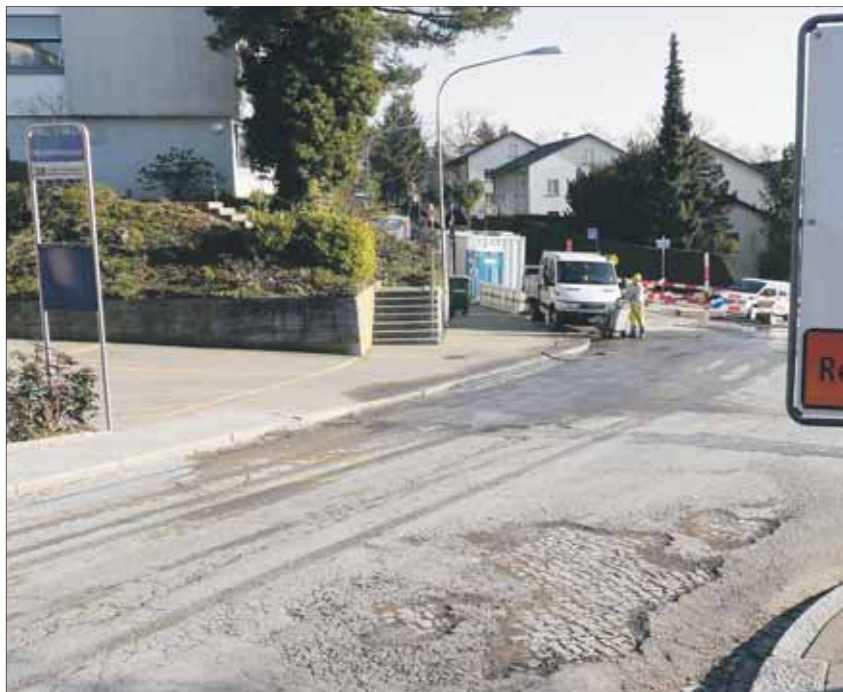
Mit Behinderungen ist zu rechnen – die Erneuerung des Belags war offensichtlich nötig.

Seit Montag, 10. Januar, werden im Bereich Michelstrasse, Engadiner- und Benedikt-Fontana-Weg Sanierungsarbeiten an Werkleitungen von Strom, Wasser und Telefon ausgeführt. Gleichzeitig wird der Strassenbelag erneuert, was dringend nötig war, denn der Asphaltbelag – seinerzeit einfach direkt auf das Kopfsteinpflaster aufgetragen – war längst mehr Flickenteppich denn Fahrbahn. Auch werden an der Michelstrasse die Gehwege örtlich verbreitert, die Bushaltestellen Friedhof Hönggerberg und Michelstrasse mit einem Wetterschutz ausgerüstet sowie zur «Aufwertung des Strassenraumes», wie Markus Gerber, verantwortlicher Projektleiter beim Tiefbauamt Stadt Zürich in einer Mitteilung schreibt, zwölf Bäume gepflanzt. Der «Höngger» berichtete bereits am 4. Dezember 2008 über die geplanten Arbeiten. Peter Stocker, damaliger Projektleiter beim Tiefbauamt, hob den verkehrsberuhigenden Charakter der Bäume hervor: «Die Autofahrer sollen daran erinnert werden, dass sie in einer Tempo-30-Zone fahren.» – was manchmal tatsächlich Not tate. Die Arbeiten sollen Ende November ab-