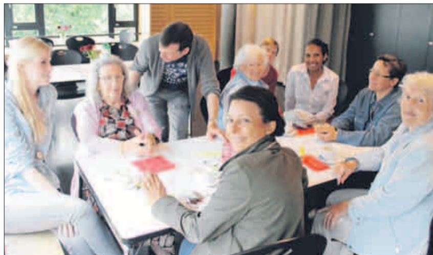
An grossen Tischen sass man gemütlich zusammen, plauderte, trank Kaffee und ass Kuchen oder etwas vom Grill.