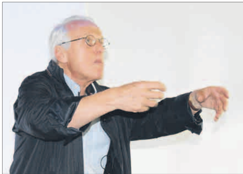
WAM parodiert da wen? Genau, Christoph Blocher.

Christoph Blocher oder Doris Leuthard vor dem lachenden Publikum. Spielt er «richtig», so dauert es zweieinhalb Stunden, sich etwa eine Glatze kleben oder eine andere Nase befestigen zu lassen. «Wenn sich dann eine parodierte Person bei mir meldet, freut mich das besonders. So etwa Ex-Bundesrat Moritz Leuenberger, der ja oft «äh» sagte in seinen Reden. Er kam zu mir und sagte: «Seit Sie mich, äh, parodieren, sage ich, äh, viel weniger dieses Äh.» Das Gelächter unter den Anwesenden zeigte, dass man sich Moritz Leuenbergers Sprechweise bewusst ist. Auch eine andere Bekanntheit lebt durch WAM auf: Globi. Seit über 35 Jahren ist er die Stimme der lieblichen Komikfigur, und das ganz ohne Stimmveränderung mittels Technik. Dass einem so auch lustige Begegnungen passieren, ist klar: «Eine Mutter sah mich und sagte zu ihrem kleinen Sohn: «Lueg det, de Globi!» Der Bub sprang umher und suchte Globi. Als die Mutter wiederholt zu mir zeigte, sagte er ganz fassungslos: «Waas? De alt Maa isch de Globi?»