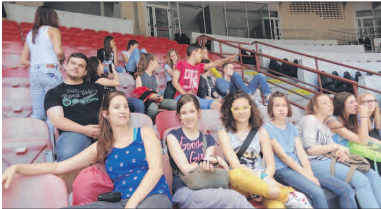
Sehen etwas «geschafft» aus: die Jugendlichen im mailändischen San-Siro-Stadion.