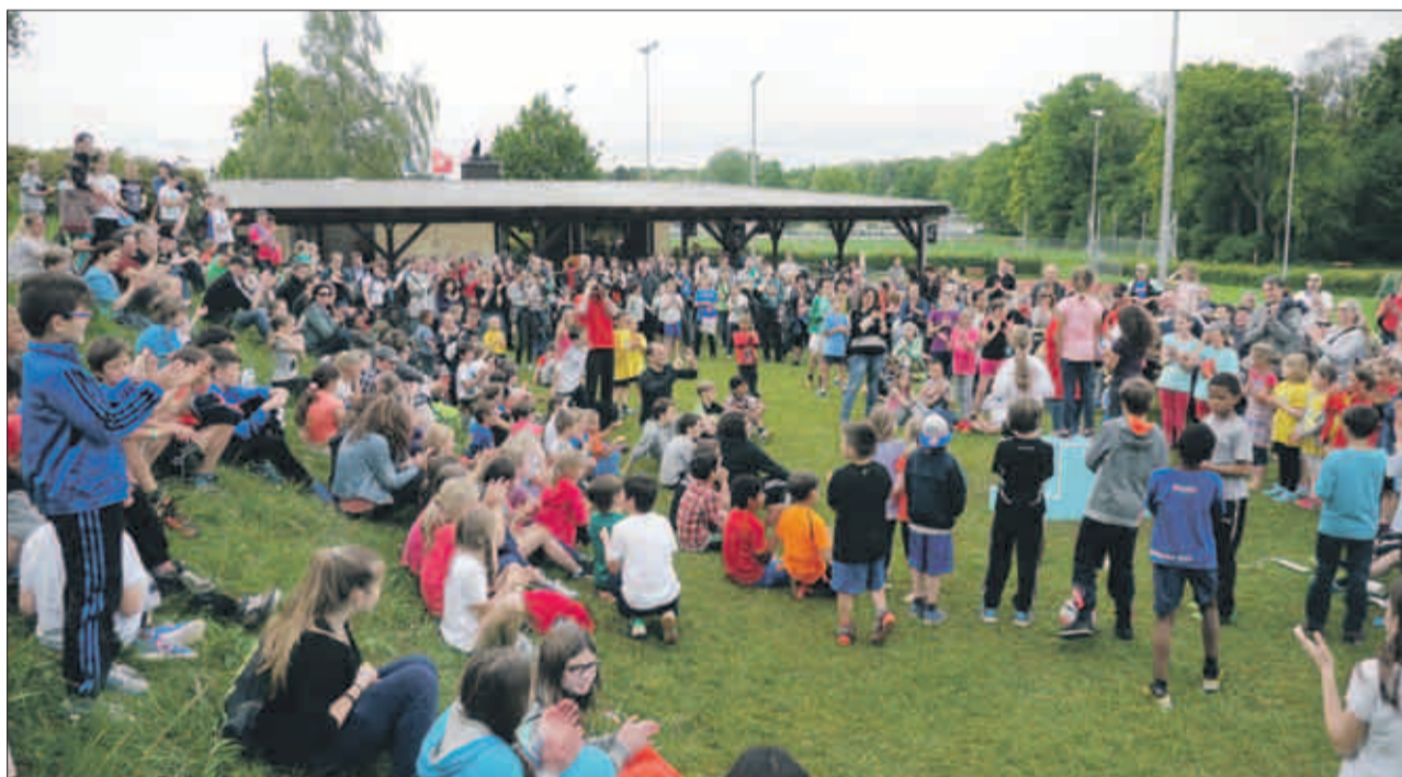
An der Siegerehrung gab es herzlichen Applaus von Eltern und Kollegen.

Während die Nachwuchssportler bei der Ankunft sogleich aufgeregt begannen, ihre Klassenkameraden zu suchen und erste Aufwärmübungen auf dem Rasen starteten, machten es sich die Mütter und Väter zunächst einmal auf den Bänken bequem und versuchten, einen ersten Überblick über das Gewusel auf dem Sportplatz zu erhalten. Glücklicherweise zeigte sich auch der Wettergott dieses Jahr, anders als in den beiden Jahren davor, endlich einmal wieder von seiner gnädigen Seite und schuf mit eitel Sonnenschein und angenehmen Temperaturen geradezu ideale Bedingungen für einen Sportwettkampf. Das gute Wetter erfreute auch die Organisatoren von Turn- und