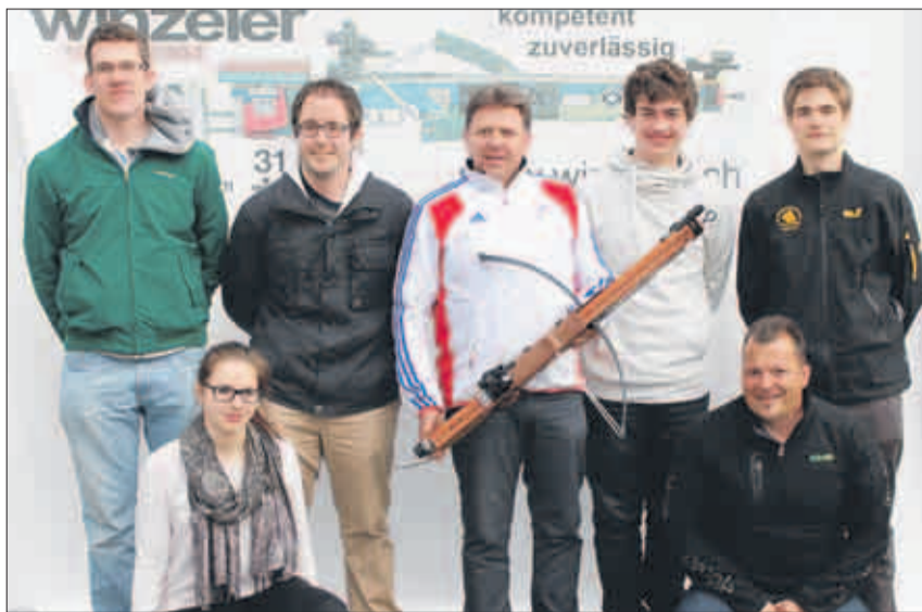
So sehen Sieger aus: Platz 2 Ried-Gibswil (SUI), Platz 1 Frankreich (FRA), Platz 3 Brestenegg-Ettiswil (SUI).