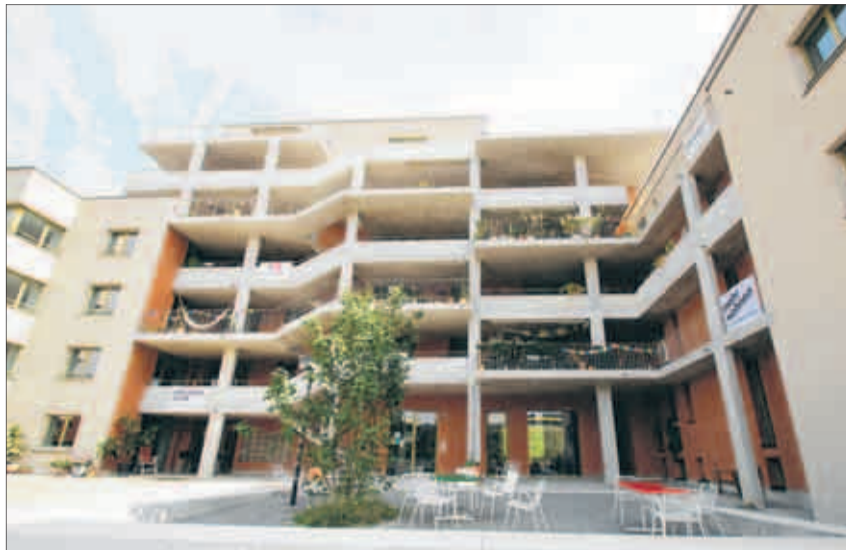
Die Überbauung Kraftwerk 2 kann auf Voranmeldung besichtigt werden.