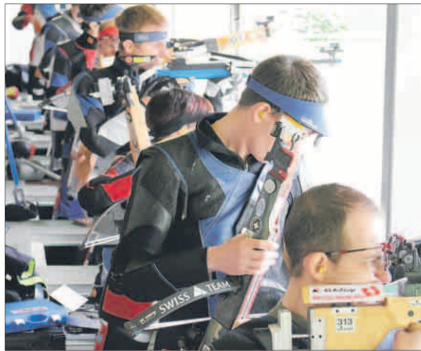
Stimmung am Wettkampftag auf dem Hönggerberg.