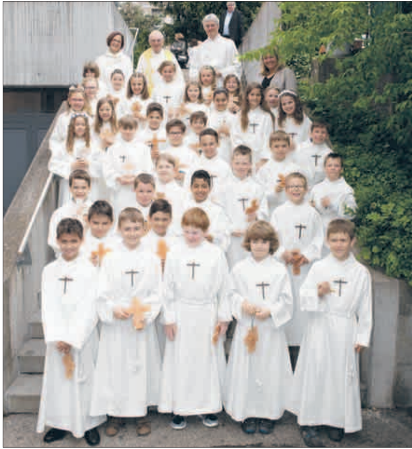
Verschiedenste Gesichtsausdrücke widerspiegeln die Emotionen.

Dieses Thema passte gut zum Fest der Erstkommunion, aber es passte auch gut zu Höngg. Die Kinder er-