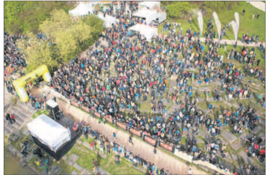
Nur schon das Zuschauen bei der SOLA-Stafette sorgt für Nervenkitzel.

Maximal 900 Teams mit rund 12 600 Läuferinnen und Läufern starten am Samstag, 17. Mai, zu einem Wettkampf rund um die Stadt Zürich. Der Grossanlass wird zum 41. Mal vom Akademischen Sportverband Zürich, kurz ASVZ, organisiert.