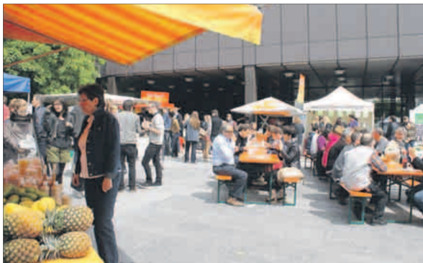
Am Markt auf dem ETH-Campus Hönggerberg kann man sich auf verschiedenste Art und Weise verpflegen – Open-Air-Feeling inklusive.

Weiter im Angebot sind bei den anwesenden Ständen Crêpes, Pastage-