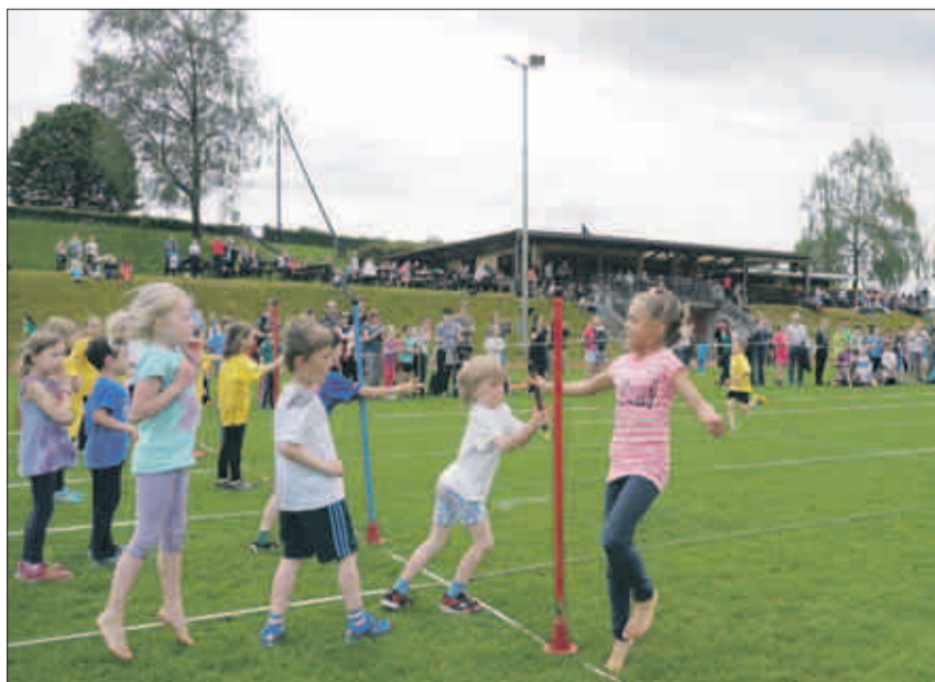
Die Gewinner dieses Stafettenjahrgangs beim Stabwechsel.