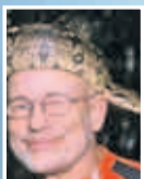
Rüdiger Nehberg Survival – Abenteuer – Menschenrechte