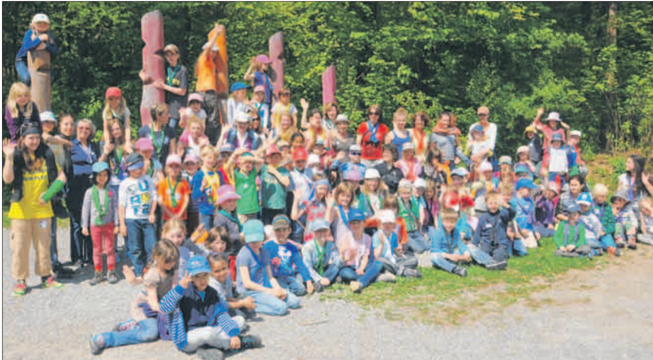
In beiden Lagern hatten die insgesamt 127 Mädchen und Buben ihren Spass und lernten viel.

Das eine Lagerlied «Hebed Sorg» hätte passender nicht sein können.