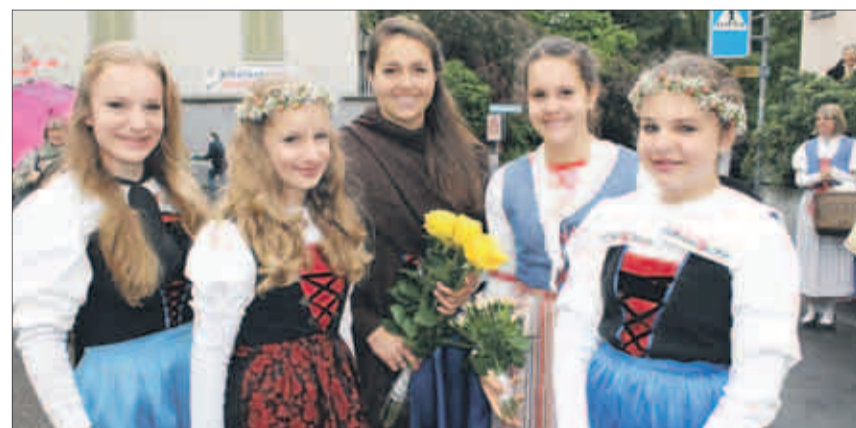
Bei diesem Strahlen konnte man gar nicht anders als auch zu lächeln: junge Damen beim Zuhören des Höngger Zunftspiels.