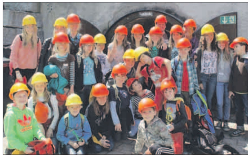
Bei der Lorenfahrt ins Bergwerk Horgen wurden die Kinder mit Helmen ausgerüstet.