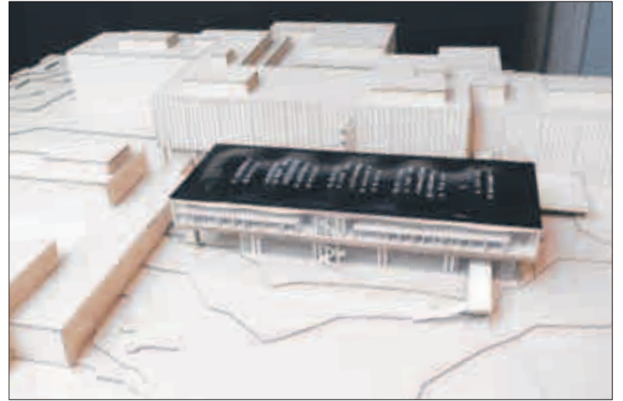
Der Neubau im Modell: gut sichtbar die geschwungene Dachkonstruktion mit den Normfenstern.

Herzstück des Erdgeschosses wird eine Robotikhalle. Dort werden an fahrbaren Deckenkonstruktionen aufgehängte Industrieroboter neue Fertigungstechniken vor Ort testen können. Über der Halle wird ein zweigeschossiger Raum mit umlaufender Galerie angelegt. Die Raumaufteilung ist so gestaltet, dass sie