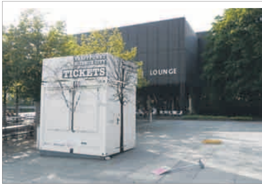
Das Personal des Info-Containers wird für Fragen zur Verfügung stehen.