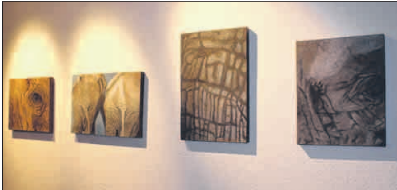
Die «Elefanten-Serie» stiess auf grosses Interesse dank der unglaublichen Detailtreue.