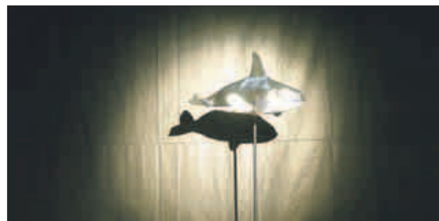
«Ich han en Schwertwal ide Stube», sangen die «Spechte», in Höngg hatte er seinen Platz auf der Bühne.

Absurd und kurios verlief auch der zweite Teil des Abends. Den drei schrägen Vögeln gelang es, das Publikum in den Bann zu ziehen. Zwischen teils fast traurigen Songs, die auch immer sehr melodios sind und fast zum Mitsingen verleiten (das sollte man unter keinen Umständen tun!) und von einer Vielfalt von Instrumenten begleitet werden, beflügeln sie die Gäste mit wiederholten