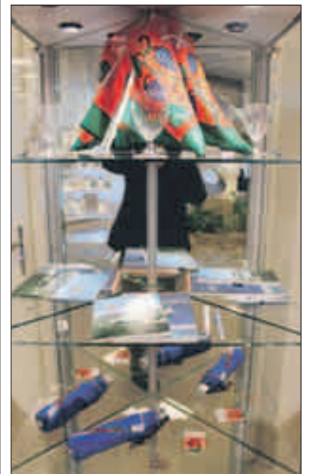
Die Höngger Artikel eignen sich für alle Gelegenheiten.

Der Renner sind laut ZKB die Wappen-Kleber, welche nicht nur einige Autos, sondern auch Kinderwagen und Taschen der Hönggerinnen und Höngger zieren. Schalteröffnungszeiten: Montag bis Freitag, 9 bis 12 Uhr und 13.30 bis 16.30 Uhr, Samstag geschlossen. Weitere Informationen: Telefon 044 344 54 31. (mg)