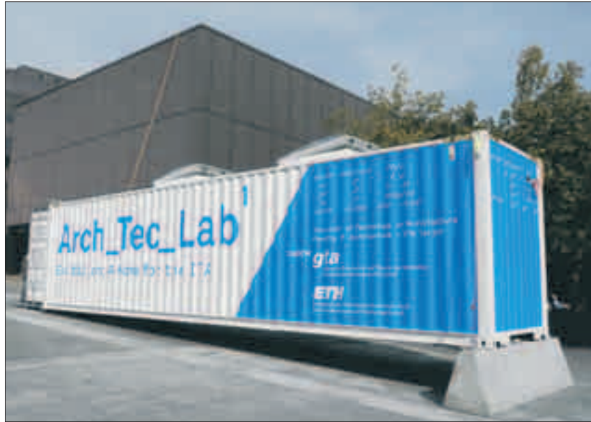
Der Schiffscontainer als Ausstellungsraum, Campus ETH Höggerberg.

Gut sichtbar steht er da, auf der Piazza der ETH Höggerberg, gleich vor der Alumni Lounge: der blaue Frachtcontainer, der derzeit als Ausstellungsraum (siehe Kasten) für das Neubauprojekt des Instituts für Technologie in der Architektur (ITA) dient. Pläne, Visualisierungen, Monitore und ein Modell zeigen die Ent-