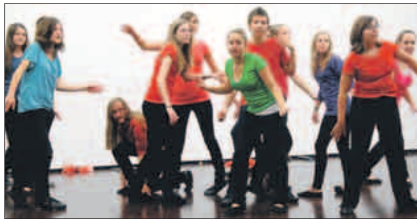
Einige der Stücke werden durch Choreografien ergänzt.

Während einer Woche haben sich Jugendliche im Alter von 13 bis 20 Jahren in Flawil unter der Leitung von Marcel Fässler und weiteren Fachpersonen auf die Konzerte vorbereitet. Das Projekt ist ein Angebot der Aargauer und Zürcher Kantonal-Gesangvereine. Die Jugendsingwoche verfolgt mehrere Ziele: jungen Menschen die Freude am Gesang zu vermitteln, an der eigenen Stimme zu arbeiten und nicht zuletzt, die Sängerinnen und Sänger der Chöre für die Notwendigkeit der Nach-