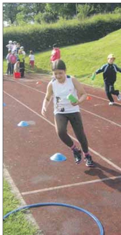
Action war bei den Kindern angesagt.

Nach den sportlichen Disziplinen am Morgen für die Mittelstufe und den Spielen für die Unterstufe und den Kindergarten ging es am Mittag in einer langen Reihe zum Alten Waidbad. Dort assen alle zusammen ihren mitgebrachten Zmittag. Trotz