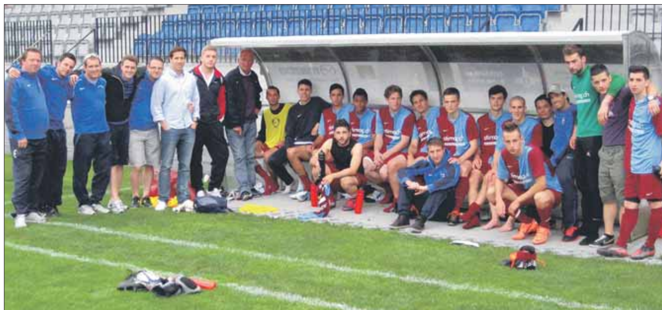
Die Saison hinter sich gebracht und den Liga-Erhalt geschafft: die Spieler des SV Höngg.