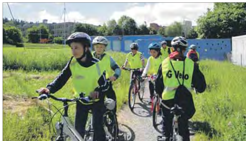
Mit dem Velo «erfährt» man die Umgebung ganz anders. Dass man sich dabei gut schützt, ist selbstverständlich.