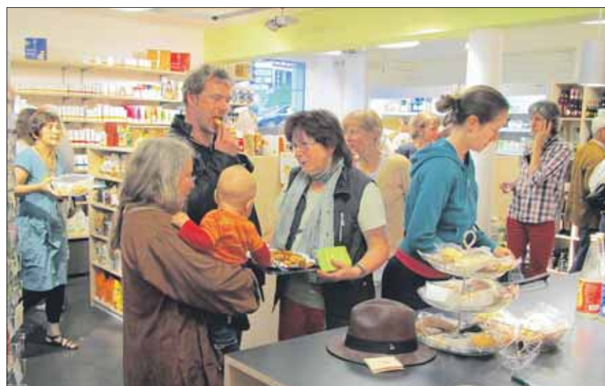
Alle Hände voll zu tun für Personal und Kunden im canto verde.

So auch am Freitagabend, 1. Juni, als der canto verde seinen einjährigen Geburtstag feierte. Ein junges Musikertrio lockte Kunden und Passanten mit lüpfigen Melodien vor und in den Laden. Zu Klängen aus einem grossen Repertoire von Tango, Jazz und Klezmer degustierte man zu Bio-Weinen Häppchen aus dem Sortiment. Die Mitarbeiterinnen trugen T-Shirts, Röcke und Accessoires aus dem Laden und zeigten, wie modisch fair gehandelte und ökologisch produzierte Textilien kleiden können.