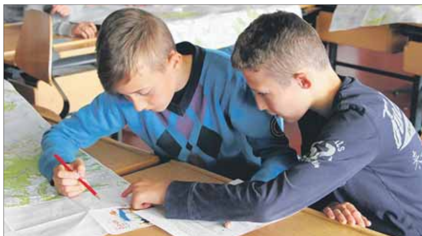
Auch Kartenlesen will gelernt sein.

Die Werbefreaks unter den «Rütihof»-Schülern suchten in den Medien nach Werbung für verschiedene Verkehrsmittel und Mobilität allgemein und texteten eigene Slogans für Verkehrsmittel: «Schnell und bequem unterwegs», «Zu Fuss geht alles» oder «Reisen Sie mal schnell um die Welt» waren nur einige davon. Angeleitet durch das Hörspiel «Salzwasserte» mussten sich die «Rütihöfler» im Niederdörfli orientieren. Zudem galt es in einem Postenlauf, das Wissen über Zürich zur Römerzeit, im Mittelalter und in der Neuzeit zu erweitern