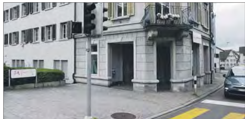
Vom Restaurant zu Bank, Versicherung und «Modegeschäft» und jetzt geschlossen: die Lokalität im Haus «Central» am Meierhofplatz.

Wie gut ist die Angebotsbreite im Zentrum von Höngg? Wie wichtig ist Ihnen ein kundenorientiertes Angebot im Dorfszentrum? Was würden Sie sich an neuen Angeboten wünschen? Kaufen Sie selbst bei den Detailisten ein? Wenn nicht warum? Schreiben Sie uns Ihre Meinung bitte zahlreich per Mail an redaktion@hoengger.ch oder per Brief an: Redaktion Höngger, Winzerstrasse 11, 8049 Zürich.