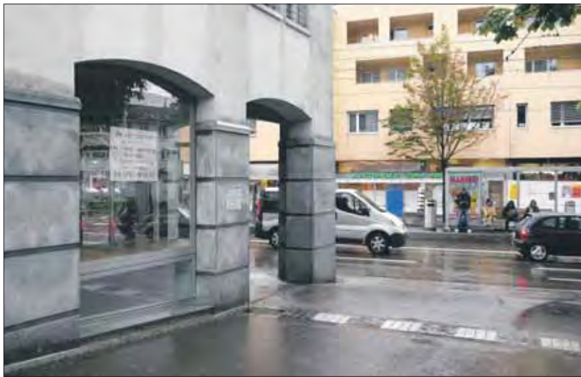
Schlechtwetter am Meierhofplatz? Links das leere Ladenlokal im Gässli 2, hinten rechts die weisse Bauwand, wo einst die Dorfmetzger war. (Fotos: Fredy Haffner)

Der «Höngger» wollte sich nicht weiter im Stillen fragen, sondern kontaktierte die Besitzer und die Verwaltungen der freistehenden Lokalitäten. Die Frage lautete bei allen gleich: Nach welchen Kriterien werden freie Ladenflächen neu vermietet? Gelten nur finanzielle Interessen oder ist man bemüht, Firmen und Detaillisten mit Läden nach Höngg zu bekom-