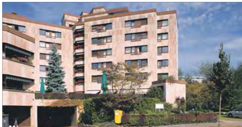
Im oder vor dem «Riedhof» geht auch nach 30 Jahren noch die Post ab.