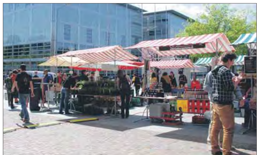
Lokale Spezialitäten in nahem und sehr modernem Umfeld.

Der Frühling- und Herbstmarkt war das Siegerprojekt beim Ideenwettbewerb «Science City mitgestalten» im Jahr 2009. Die Idee ist, lokale und regionale Produkte zu fairen Preisen anzubieten. Die Marktstände verkauf-