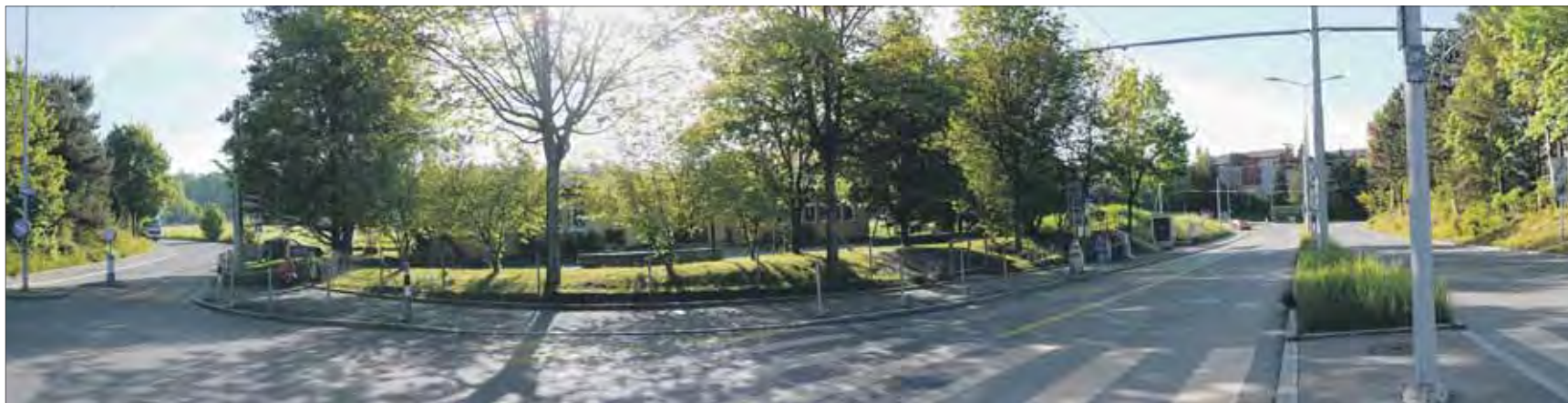
Panoramabildmontage vor Ort: Die projektierte Einfahrt zum «Ringling» wurde von der Geeringstrasse (rechts) in die Strasse Im oberen Boden (links) verlegt. (fh)

Seit Mitte März stehen die neuen Baugespanne für die Grossüberbauung «Ringling» im Rütihof. Einziger Unterschied zur letzten Auflage: Die geänderte Zufahrt. Kein Unterschied: Die «IG Pro Rütihof – contra Ringling» rekurriert erneut.