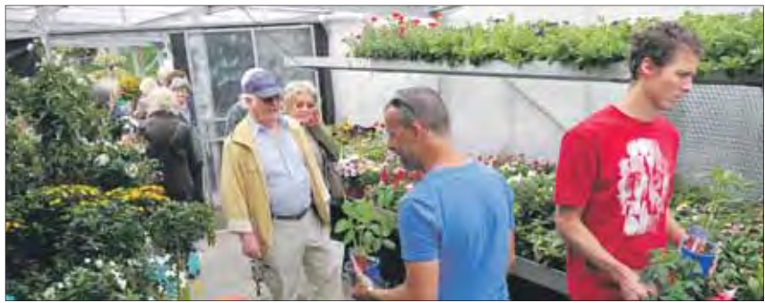
Grossandrang am 1. Mai zwischen Pflanzen, Häppchen und Wein. (fh)

Der 1. Mai war für das Team von Graf Grünart ein wahrer «Tag der Arbeit»: Mehr als 500 Neugierige besuchten die Saisonöffnung der Gärtnerei.