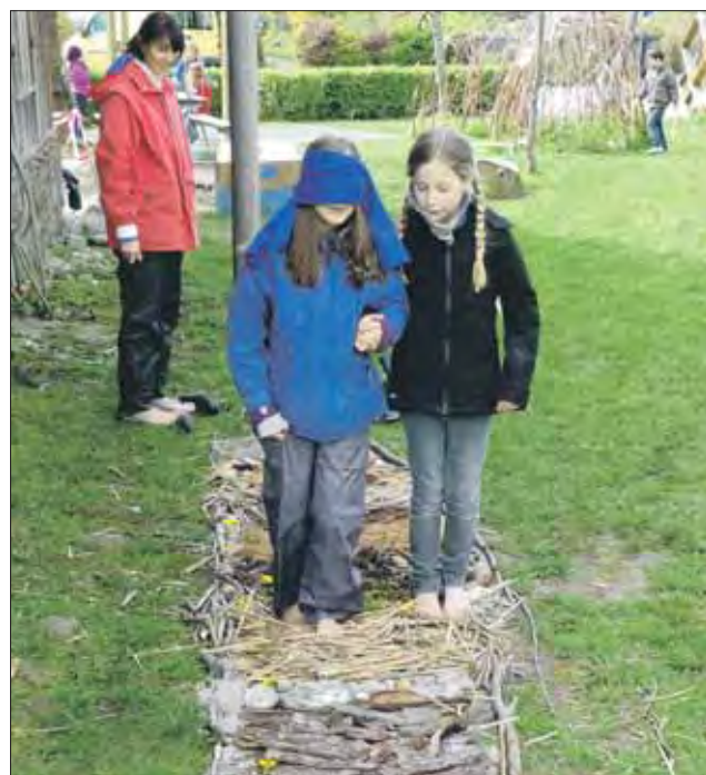
Natur mit allen Sinnen erleben: Es gab viel Überraschendes zu entdecken, auch der Jöh-Effekt blieb nicht aus.

«Für die Umsetzung im April und Mai habe ich intensiv zur Thematik recherchiert, um herauszufinden welche Möglichkeiten es im und um das Quartier gibt, Kontakte hergestellt und zusammen mit den Koopera-