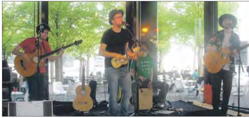
Die Studentenband «Lazen» überraschte mit Theatereinlagen.

Auf Englisch begrüsst die vier Musiker ihre hauptsächlich aus Studierenden bestehende Zuhörerschaft und begannen mit ihrem neuen Programm «Tea for beginners». Dieses beinhaltete rund zwanzig jazzige, ro-