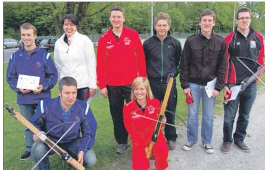
Erfolgreiche Armbrustschützen: 1. Rang: Münster/Tirol (AUT) Mitte, 2. Rang: Bund München (GER) rechts, 3. Rang: ASV Ried-Gibswil (SUI) links.

Das Team besteht wiederum aus drei Wettkämpfern. Zwei im Voraus definierte Resultate aus der HZM-Wertung werden mit einem 10-Meter-Resultat (60 Schuss) zusammen-