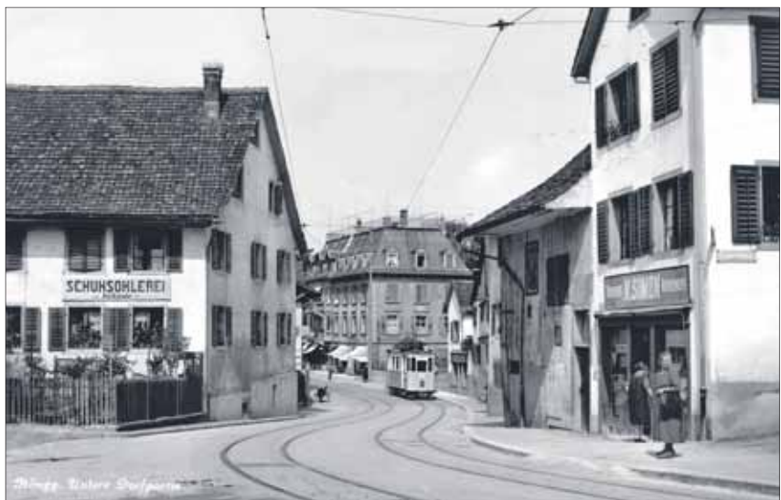
Damals so eng wie heute noch, aber viel stärker frequentiert: das Nadelöhr zwischen Meierhof- und Zwielpplatz.