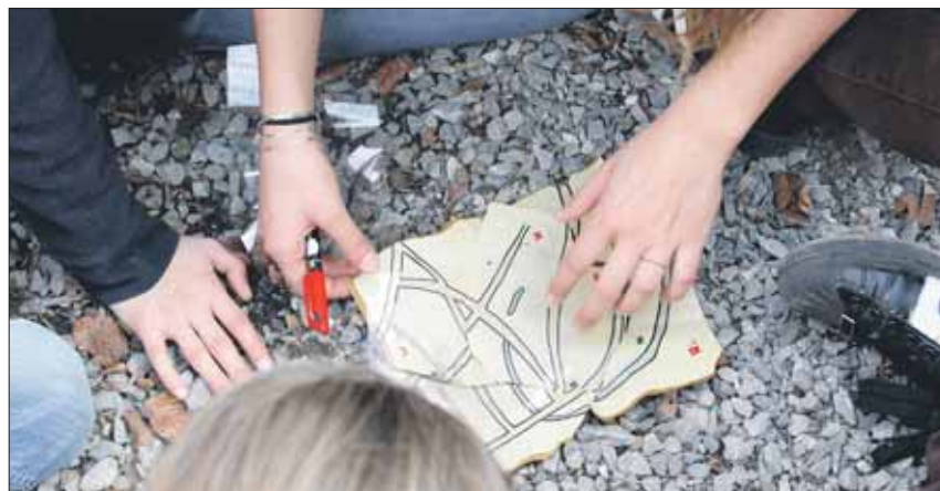
Beim Zusammensetzen der Schatzkarte war Geschick gefragt.

Sicher wurde er von einem starken Römer ins Dorf getragen. Da die Mitglieder der Gewinnerfamilie jedoch nicht so viele Pfadi-Krawatten verzierten und brauchen konnten, beschlossen sie, ihren Schatz mit allen zu teilen. Zur Stärkung nach diesem anstrengenden Nachmittag bekamen alle eine köstliche römische Suppe. Diese wurde genussvoll verspeist, denn es stand ja noch der anstrengende Abstieg zurück zum Bläsiplatz und in die Zivilisation bevor. (e)