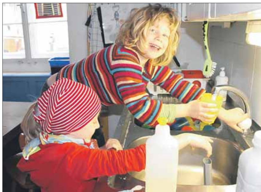
Kinder beim Abwaschen: Im «Freien Kindergarten Hönnggerberg» helfen die Kinder auch in der Küche mit – wenn sie Lust dazu haben.

Diese wurden dann mehrheitlich von den Erwachsenen auf den Eiern befestigt, mit Strümpfen überzogen und im Zwiebelsud gefärbt. Während des ganzen Nachmittags herrschte eine zufriedene Stimmung im Haus und um das Haus herum und es entstanden wunderschöne, bunte, ganz individuelle Ostereier, welche am Osterwochenende am Frühstückstisch für viel Freude und Staunen sorgen werden. (e)