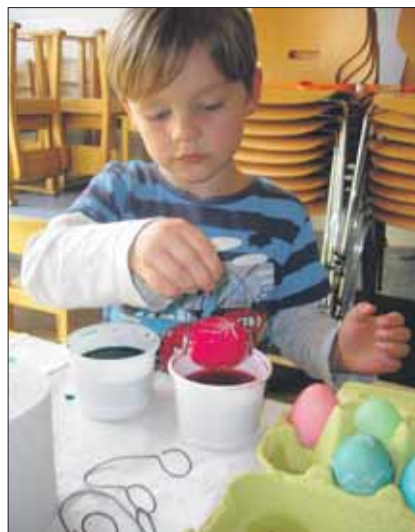
Junge beim Eierfärben: Mit viel Konzentration färbte dieser Bub ein Ei.

Am Samstagnachmittag herrschte in der Quartierschüür an der Hurdäckerstrasse emsiges Treiben: Über vierzig Personen nutzten die Gelegenheit, gemeinsam bunte Kunstwerke herzustellen. Der El-