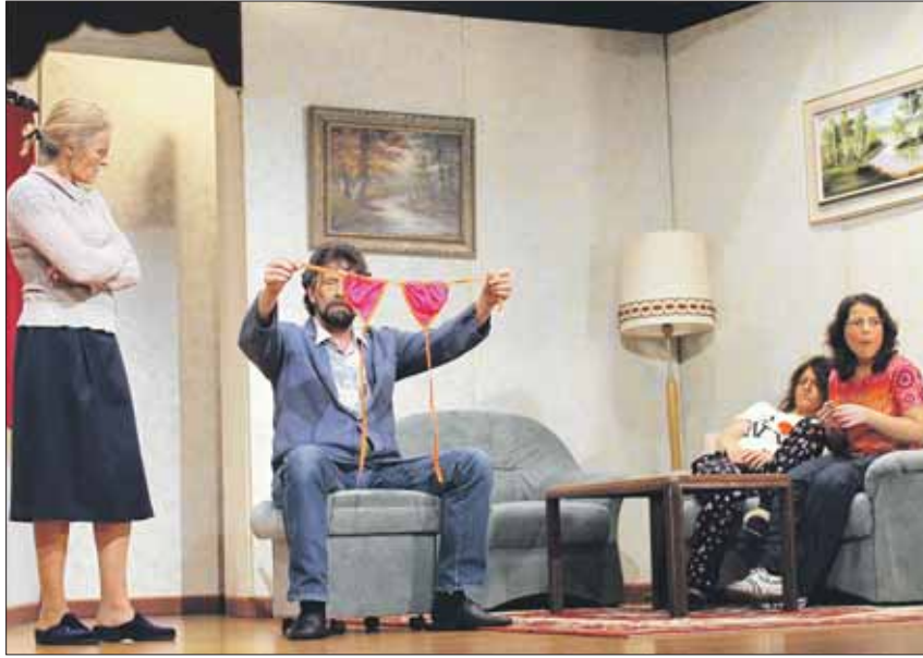
Ein Bikini-Oberteil in Vater Witzigs Jackentasche?

Nachdem sich das Seniorenpaar endlich auf die Bühne gekämpft hat, verkündet der Opa genannte Herr, er müsse noch ganz wichtige Leute im Publikum begrüßen und kramt in Omas Handtasche einen Zettel hervor. «Brot, Chäs, WC-Papier, Kuki-