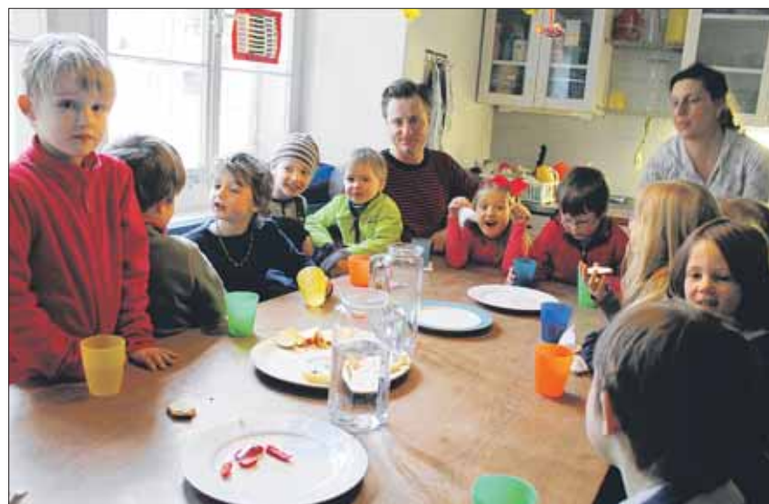
In der Znünipause sitzen alle zusammen und machen eine kleine Pause vom Herumtoben oder Basteln.

Den Einkauf für das Essen macht jeweils der Elternteil, der zum Kochen eingeteilt ist. «Zum Znüni gab es Hüttenkäse und Brot sowie Früchte. Zum Mittagessen koche ich einen Risotto», so der Österreicher. Er schätzt es, dass die Kinder durch die rund 30 Eltern ganz verschiedene Geschmäcker kennenlernen. «Ich frage die Kinder jeweils, ob sie mir etwas helfen wollen, und meist habe ich Helfer in der Küche, die Gemüse rüsten, den Tisch decken oder abwa-