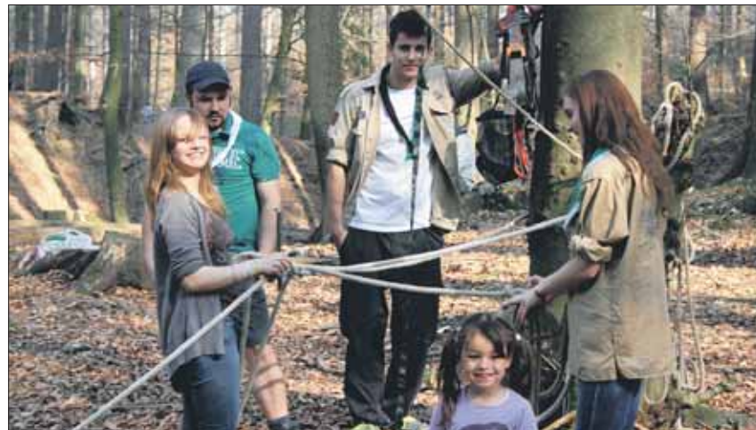
Ob klein oder schon grösser, der Pfaditag brachte allen Spass und Spannung. (zvg)

Gesagt, getan: Die Abenteuerer wurden auf die drei Familien aufgeteilt,