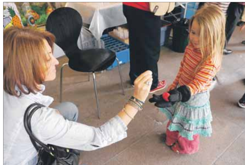
Spass für Jung und Alt: «Zwänzgerle».

Am kommenden Ostersamstag kann in Höngg nun wieder «zwänzgerlet» werden: von 10 bis 15 Uhr vor der Züri Gsund Apotheke im Brühl und neu auch vor der Drogerie Höggermarkt. Damit bedanken sich die beiden Gesundheits-Spezialisten bei der Högger Bevölkerung für ihre Kun-