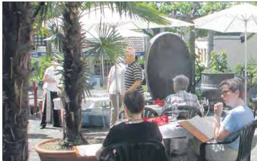
Stetig fanden Gäste den Weg in den Gartenbereich, der nur für das Hoffest etwas einfacher bestuhlt war und sonst festlicher daherkommt.

Bis 18 Uhr konnten die Gäste im Garten und den Innenräumen des neuen Restaurants verweilen und die Stimmung geniessen. Danach begann für das Restaurant der reguläre Abendbetrieb. Insgesamt gefällt den Besuchern das neue Konzept, was die neuen Reservationen und die Anzahl bisheriger Restaurantbesucher bestätigen. Man freut sich, in Höngg einen Ort bekommen zu haben, wo Jung und Alt ein gutes Steak mit einem vollmundigen Glas Wein zu sich nehmen kann.