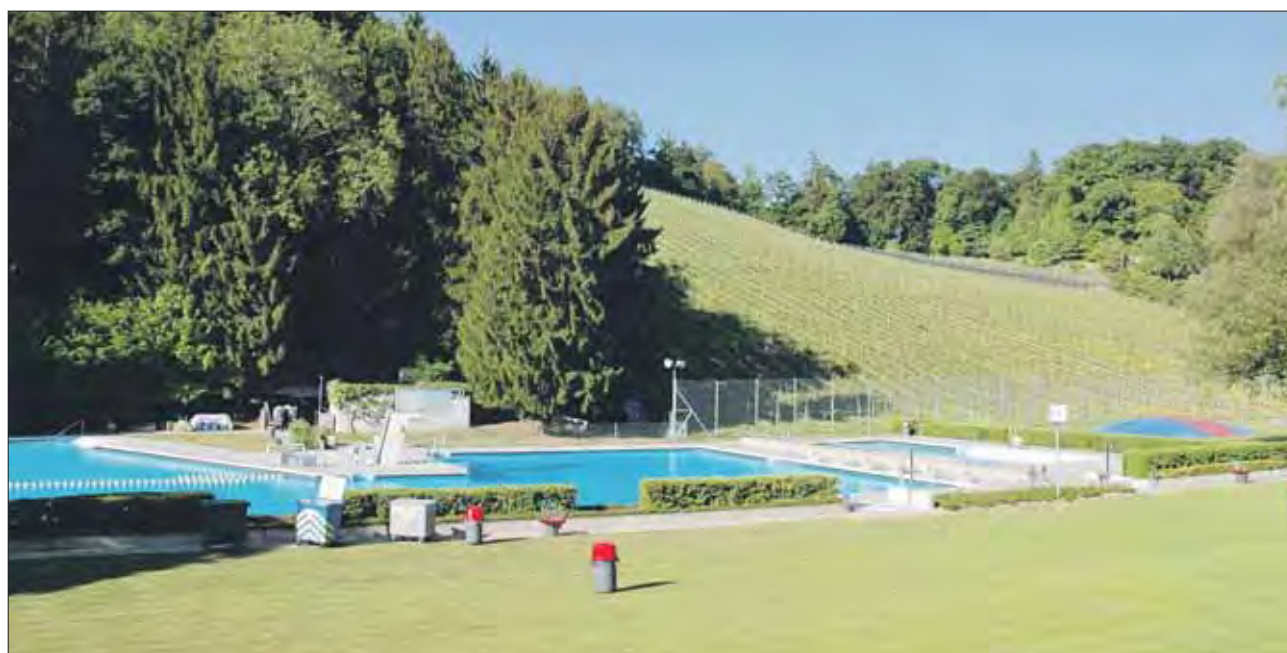
...direkten Blick auf die idyllisch gelegene Anlage, die in diesen Tagen wohl kaum so leer sein dürfte.