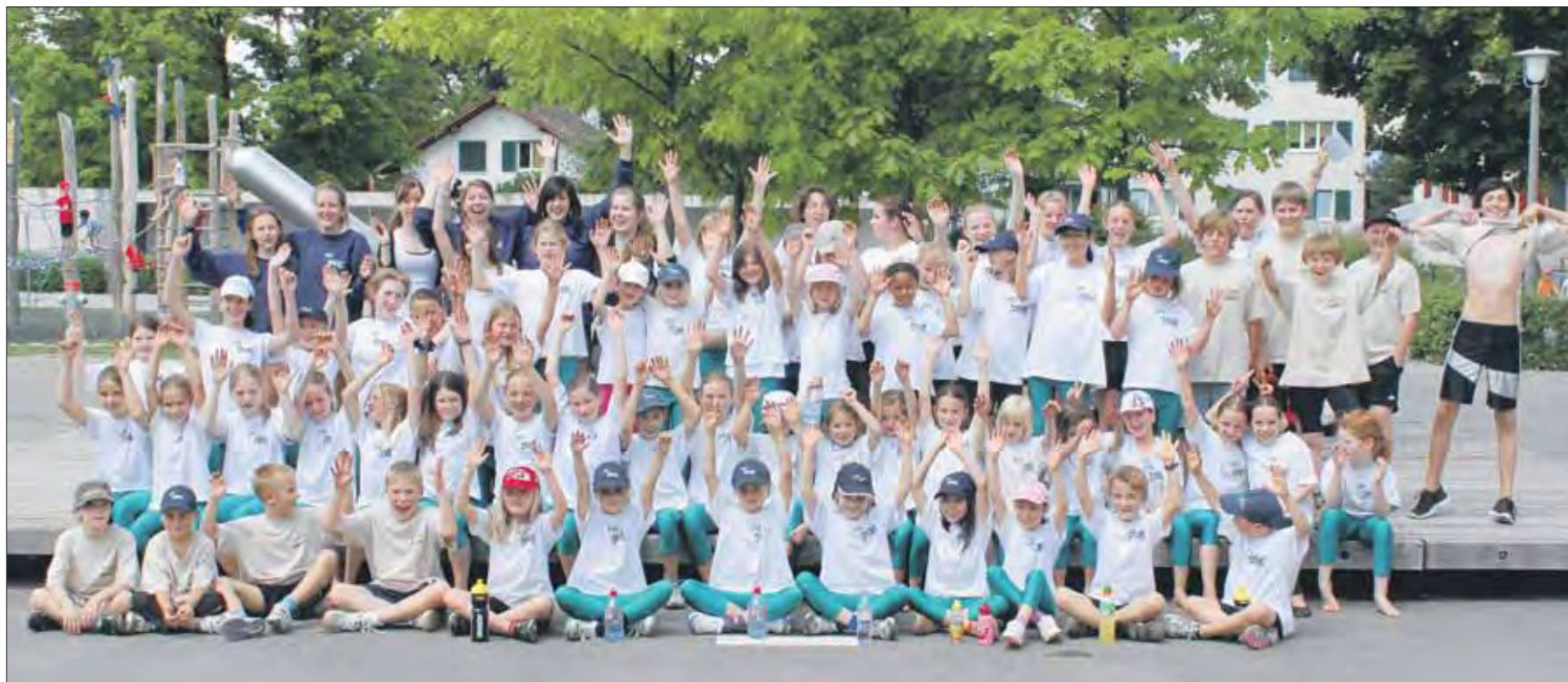
Die Delegation des Turnvereins Högger: die Welle für einen wie immer ausgefüllten Tag.