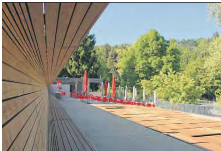
Die Liegeterrasse des Freibades «Zwischen den Hölzern» wurde mit neuen Elementen aufgefrischt und bietet...

Freibad Zwischen den Hölzern, 8102 Oberengstringen, Telefon 044 750 01 77. Täglich offen bis 12. September von 9 bis 11 Uhr bei jeder Witterung, 11 bis 20 Uhr je nach Witterung längere oder kürzere Öffnungszeiten. Bei schlechter Witterung wird das Bad geschlossen. Tägliche Informationen unter www.stadt-zuerich.ch , Schul- und Sportdepartement.