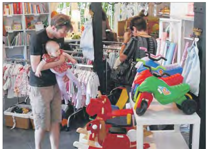
Auch die Kleinen machen schon grosse Augen bei dem breit gefächerten Angebot bei «Pimpinilli».