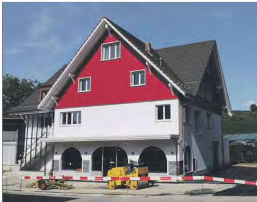
Das schöne Gebäude kurz vor dem Einzug des neuen Hofladens.

Wegmanns blieben stets auf der Suche nach neuen Angeboten und