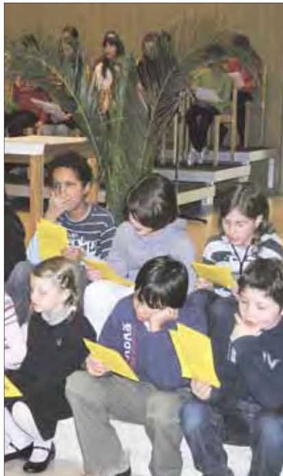
Zusammen singen unter Palmzweigen.

Der Familiengottesdienst am Palmsonntag ist immer ein freudiges Ereignis mit einer ganz besonderen Stimmung.