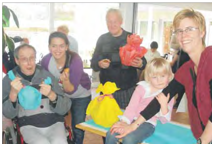
Freude über die gewonnenen Preise!

Im Laufe des Nachmittages wechselten die Gruppen der Feinschmecker und der Künstler und fast jeder liess seiner Kreativität freien Lauf. Die Mitarbeiterinnen der Therapie führten die Gäste in die Kunst des Eierfärbens ein. Mit viel Freude und