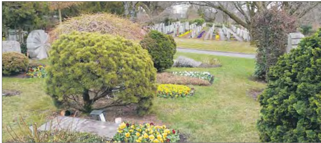
Familien- oder Reihengrab? Der Weg zu einem Grab auf dem Hönggerberg ist nicht immer einfach.