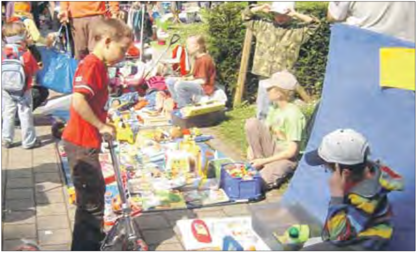
Immer eine bunte Stimmung, wenn Kinder am Handeln sind.