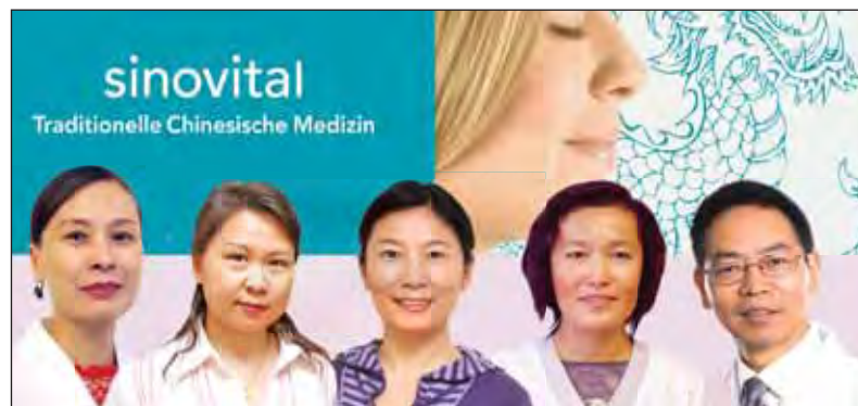
Chinesische Fachkompetenz in Schweizer Qualität

Samstag, 17. April, Aussichtsterrasse Wärmebad Käferberg. Grill ab 18 Uhr, Vorstellung um 19.45 Uhr. Kabarett-Eintritt inklusive Grillwurst 35 Franken. Reservationen Montag und Dienstag über Tel. 043 366 95 86 oder über edi.maurer@cabaredi.ch. Infos: www.cabaredi.ch.