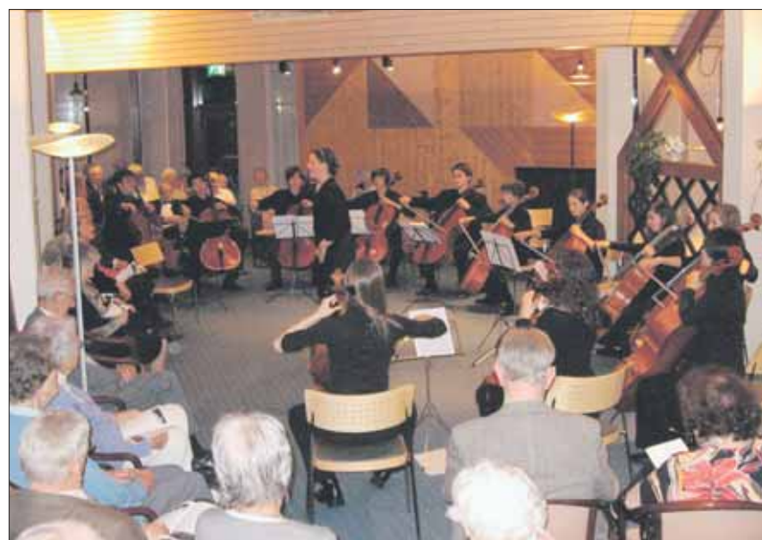
Die Musiker aus Berlin begeisterten das Publikum. (zvz)

22 Musiker und eine Sopranistin, alles Jungstudenten und Absolventen des Julius-Stern-Instituts der Univer-