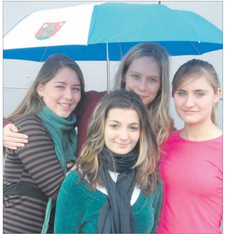
Diese vier Schülerinnen der Kantonsschule Dübendorf werden nächstes Jahr ältere Hönggerinnen und Höngger nach ihren Erlebnissen befragen.

Wer noch Fotos, Programmzettel, Anekdoten, Histörchen, Erinnerungen an das Kino im alten «Reb-