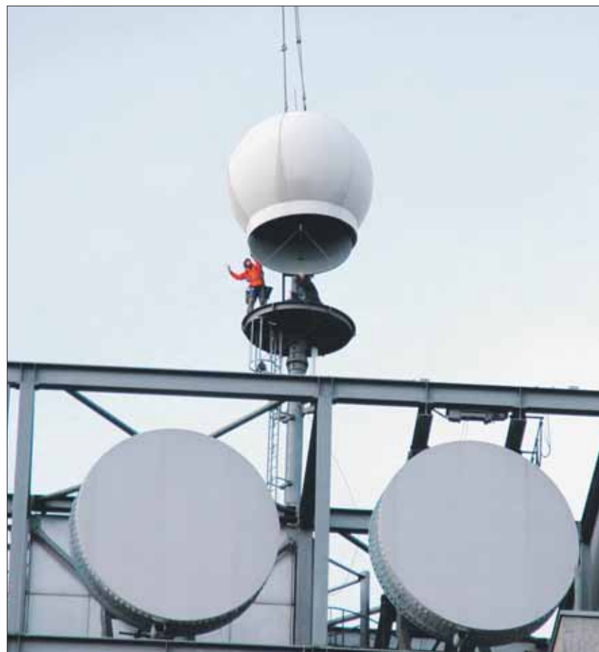
Letzten Mittwoch wurde die Radaranlage auf dem Physikgebäude abgebaut. (mei)

Letzte Woche wurde mit dem Abbau der weithin sichtbaren Radarkugel begonnen. Der Abbau des ETH-Radars bedeutet auch das Ende für den beliebten Wettervorhersagedienst Metradar.