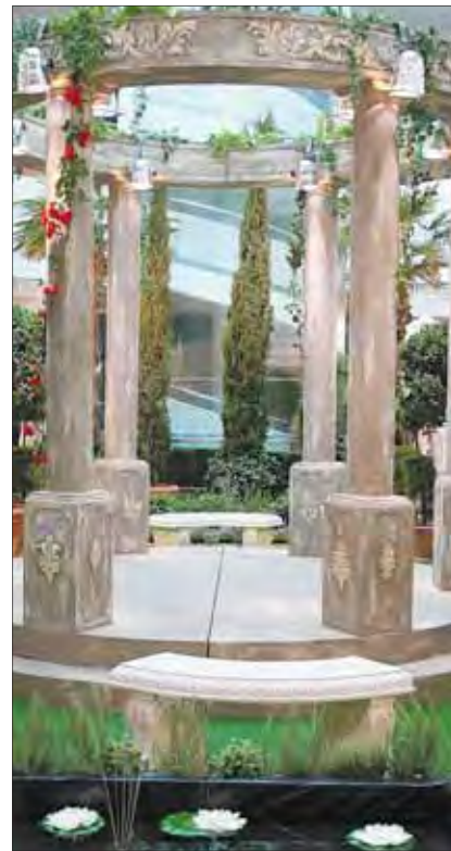
Für Verliebte warten lauschige Nischen im «Letzipark».

Eltern, die in Ruhe den Valentins-Garten geniessen möchten, wissen