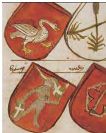
Das Höngger Wappen in der Chronik von Edlibach.

Vor der Reformation verfügte das Dorf aber über ein anderes Wappen. Gerold Edlibach stellt es im Jahre 1485 in seiner Chronik Zürichs im Bilde vor. Er hat es mit «Höngt» bezeichnet. Dargestellt ist ein geharnischter Ritter mit Schild und Fahne. Beide zeigen auf grünem Grund ein weisses Tatzenkreuz. Die Fläche des Schildes ist rot bemalt. Dargestellt ist einer der wichtigsten Heiligen der katholischen Kirche, Mauritius. Er er-