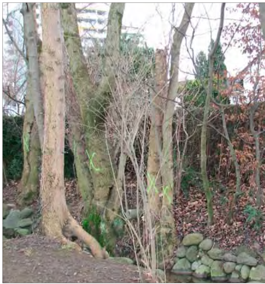
Zahlreiche ältere Bäume müssen weichen.

Leta Filli, Kommunikationsleiterin Entsorgung und Recycling Zürich (ERZ), spricht jedoch davon, dass lediglich rund 40 Bäume entlang des Bombachs gefällt werden. Besonders alte und häufig vorkommende Bäume seien gekennzeichnet worden: «Die Bäume entlang des Bombachs zwischen Riedhof- und Imbisbühlstrasse sind teilweise überaltert.» Mit den geplanten Massnahmen verhindere das ERZ, dass umstürzende Bäume