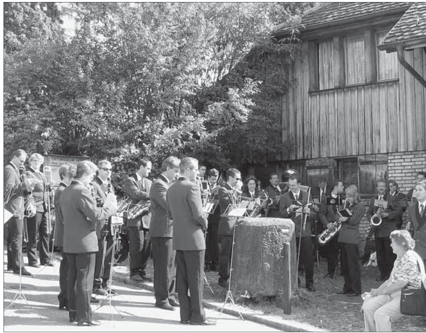
Der Musikverein Eintracht Höngg spielt zum Beginn der Vernissage im Ortsmuseum ein Ständchen.

Der Verein freue sich, den Interessierten die ereignisreiche Zeit an-