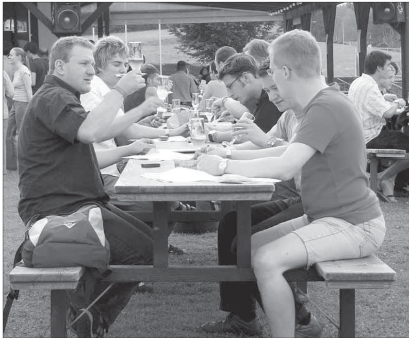
Fachmännische Bier-Degustation mit Freunden macht Spass.

Er freue sich, den Anwesenden rund 20 Schweizer und belgische Biere zur Degustation zu präsentieren. Bei der Auswahl habe der Verein darauf geachtet, Biere aus kleinen und eher unbekanntem Brauereien zu berücksichtigen. Sein Ziel sei es, auf die Vielfalt und die Kultur des Getränkes aufmerksam zu machen. Dazu eigne sich das belgische Bier gut. Das Land habe eine alte Bierkultur