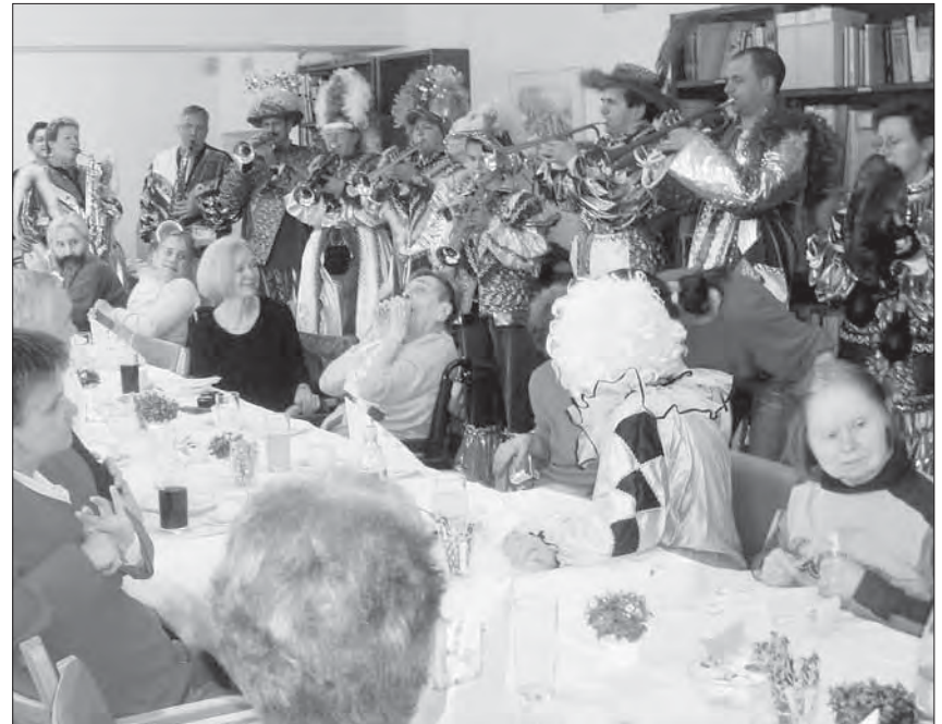
Guggenmusik Notentschalper aus Wallisellen mit Pensionären und Mitgliedern des Wohnheims Frankental.

Wer interessiert ist am Kontakt mit behinderten Mitmenschen, kann unverbindlich Kontakt mit der Institution unter Telefon 043 211 45 00 aufnehmen.