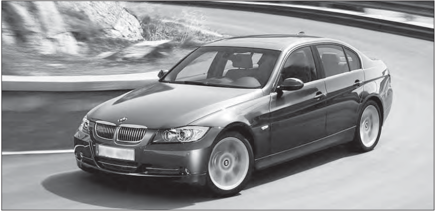
Auch der neuste BMW wird an der Ausstellung zu sehen sein.