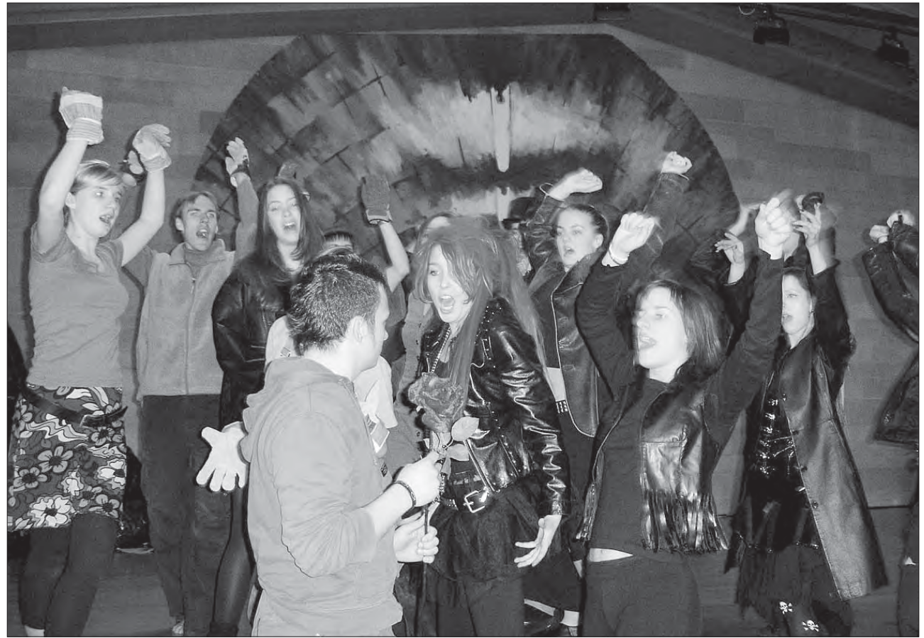
Mit viel Tanz und Emotionen zeigten die jugendlichen Schauspieler eine beeindruckende Darbietung.

Zur eigentlichen Geschichte: Das Rattenpack lebt in der Kanalisation unter der Führung der Ratte Augusto und seiner Frau. Jeder hat seine Aufgabe: Foodratten dürfen an die Oberfläche gehen und besorgen dort das nötige Essen. Die ihnen unterstell-