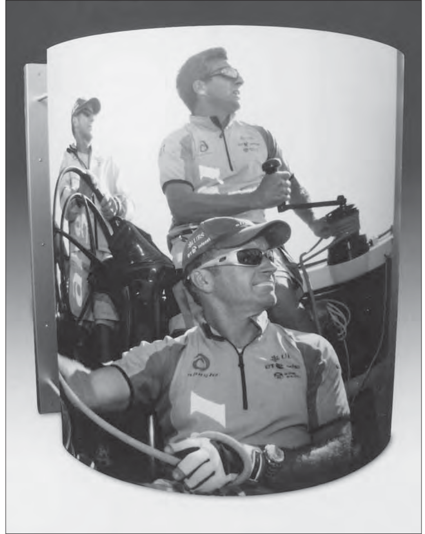
Die Sonderschau «Alinghi» ist im Einkaufszentrum Letzipark zu sehen.

Die Sonderschau lädt auch zur virtuellen Besichtigung des Bootes ein,