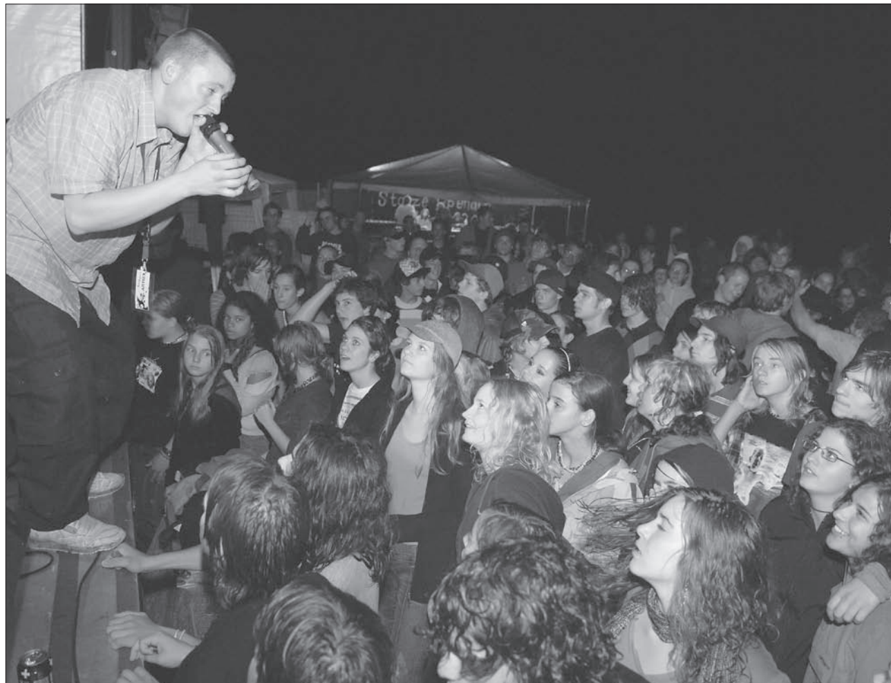
Phenomden sorgte für Stimmung am 7. Werdinsel-Openair. Trotz miesem Wetter feierten hunderte von Jugendlichen zu Hip-Hop, Dub und Rock.

Für die Verwöhnung der Ohren sorgten neben Phenomden und den ihn begleitenden Scruicalists drei weitere Bands: Den Anfang machten am Nachmittag Dub Spencer & Trance Hill mit ihrem sphärischen Dub. Die drei Zürcher sorgten mit Schlagzeug, Keyboard und sanftem Saxophon für eine einzigartig verträumte Stimmung zwischen Limmat und Kanal. Anschliessend heizten die Limmattalriders mit fettem Hip-Hop und dem Debut ihrer neusten Platten «Westwind» und «Ups'n'Downs» ein. Rauf und runter tanzte das Publikum