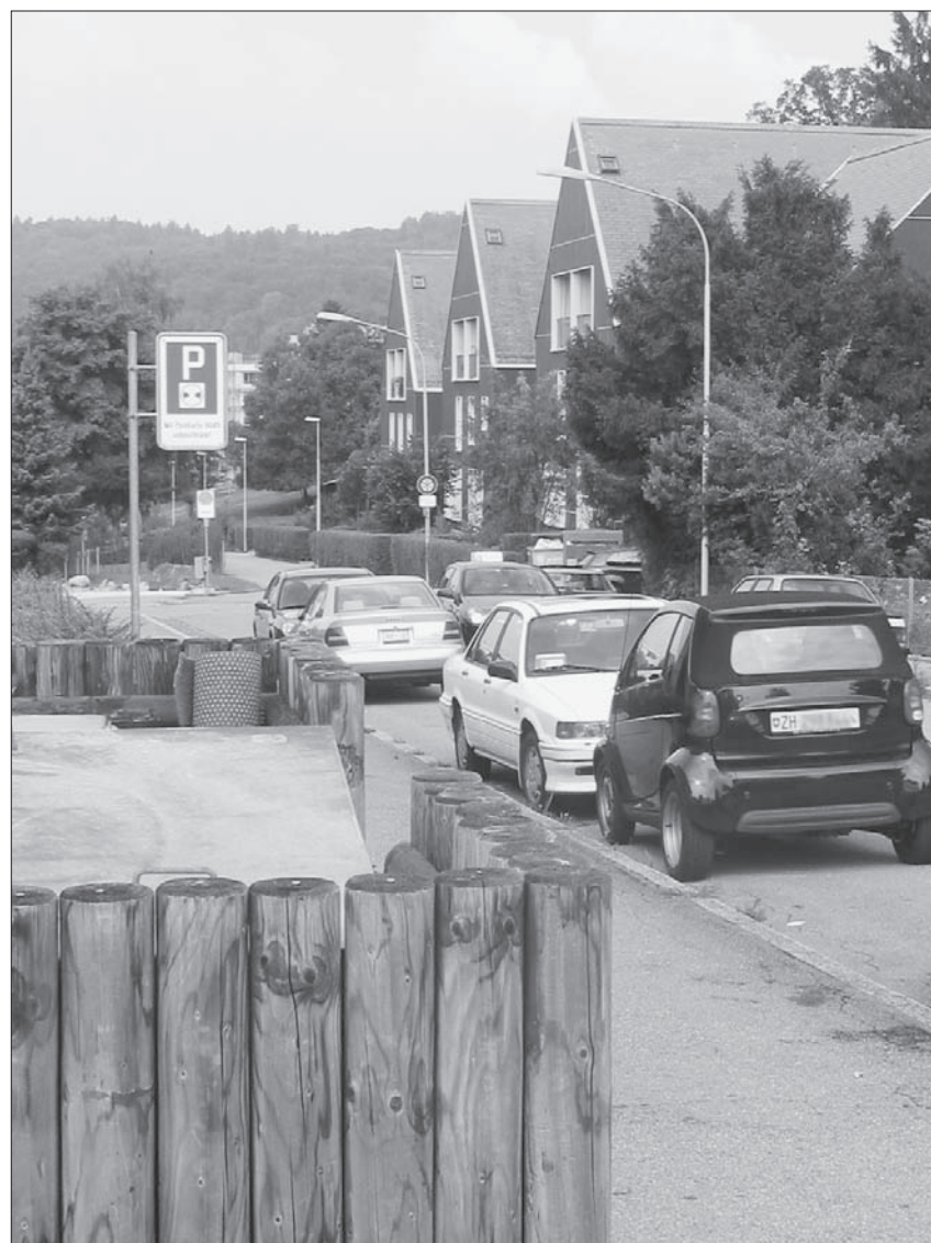
Tatort Giblenstrasse: Rückspiegel wurden abgebrochen und der Inhalt von Containern auf die Strasse gekippt.