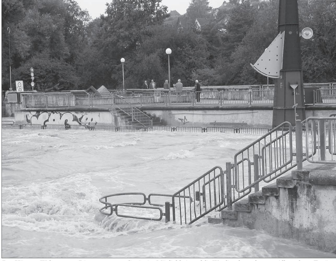
Das Höngger Wehr war am Dienstagmorgen die einzige Möglichkeit, auf die Werdinsel zu gelangen. Alle anderen Zugänge wurden aus Sicherheitsgründen gesperrt.

Durch diese Wassermassen, die das Vierfache des Normalfalls erreichten, verbreiterte sich der Flusslauf auch unterhalb des Wehres. Man kann sich kaum vorstellen, dass dort noch vor kurzem friedlich Kinder im seichten Gewässer gespielt haben. Die Liegefläche der Badi auf der Werdinsel hatte sich quasi halbiert. Bäume standen meterhoch unter Wasser. Vom unteren Teil der Werdinsel sah man ausser einigen Baumkronen nichts mehr. «Dass der untere Teil der Werdinsel auch einmal überflutet werden kann, ist so vorgesehen», beruhigt Busenhart.