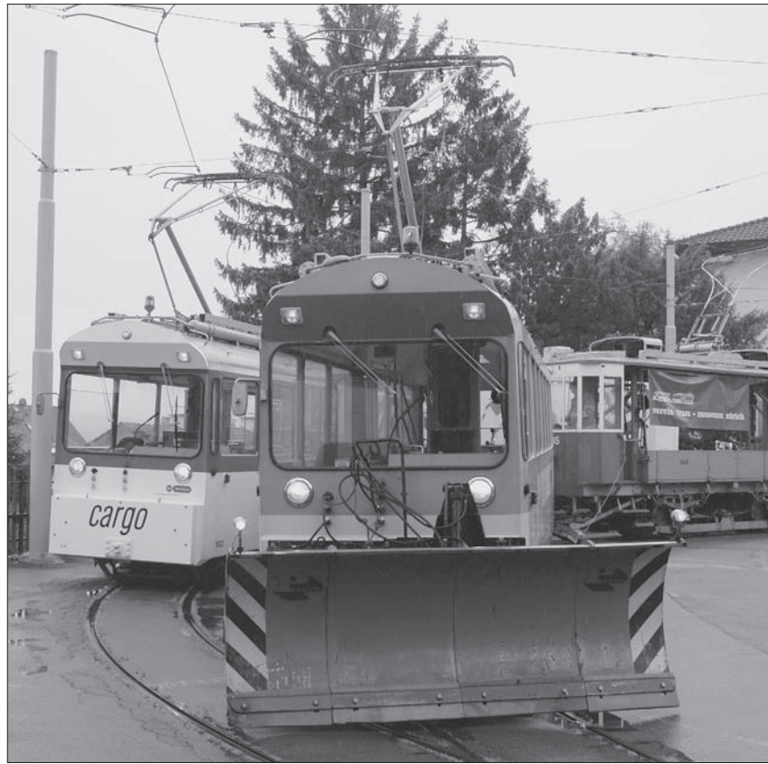
Dreier ausgestellten Dienstwagen in der Wendeschleife Wartau.