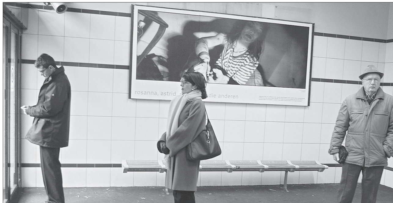
Die 30 Fotos, die zur Jahreswende in den Schweizer Städten zu sehen waren, sind nun auf dem Platzspitz ausgestellt.