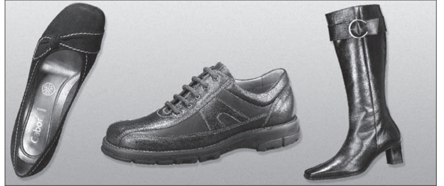
Die neue Herbst-/Winter-Mode von Tiefenbacher Schuhe.

Eccentric verbindet die Modernität der Grossstadt mit der Welt des Theaters. Sneakers und sportive Booties, Lammfellstiefel und Farmerboots lassen sich zu hochgekrempelten Jeans kombinieren. Schnallen, Klett- und Wickelbänder schmücken die neuen Schäfte. Viel Farbe zeigt Mann im Kontrast zwischen Karohemden, Westen, Lammfelljacken.