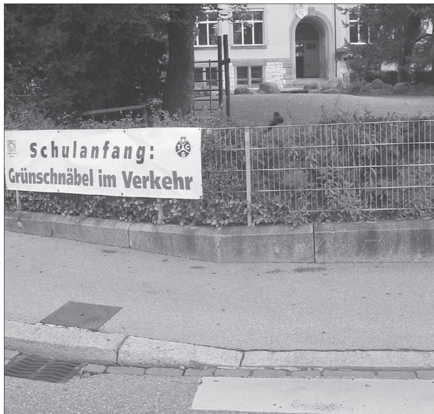
Mit diesen auffälligen Banderolen werden die Verkehrsteilnehmer vor dem Schulhaus Bläsi auf den Schulbeginn aufmerksam gemacht.

Auch dieses Jahr überwachten Polizistinnen und Polizisten 30 problematische Schulwegübergänge zu den Schulbeginn- und Schulendezeiten.