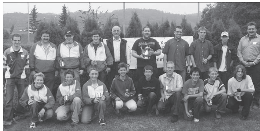
Beim Nachwuchs konnte sich Höngg (Bildmitte) deutlich vor Wollerau (links) und Hüntwangen (rechts) durchsetzen.

Die Schiessbedingungen waren hervorragend. Windstille und kaum