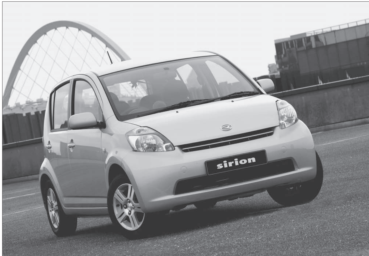
Der Daihatsu Sirion besticht auch durch sein peppiges Äusseres.

Bei Daihatsu gilt Sicherheit nicht bloss als Nebensache: Front- und Sei-