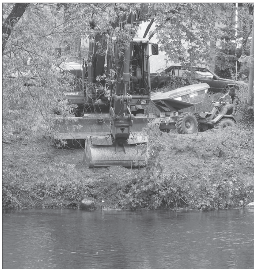
Hier wird der zwei Meter tief liegende Abwasserkanal ersetzt.

Damit die Aushubarbeiten für den Kanalersatz erfolgen können, mussten am vergangenen Montag die Bäume und Sträucher entlang der Limmat