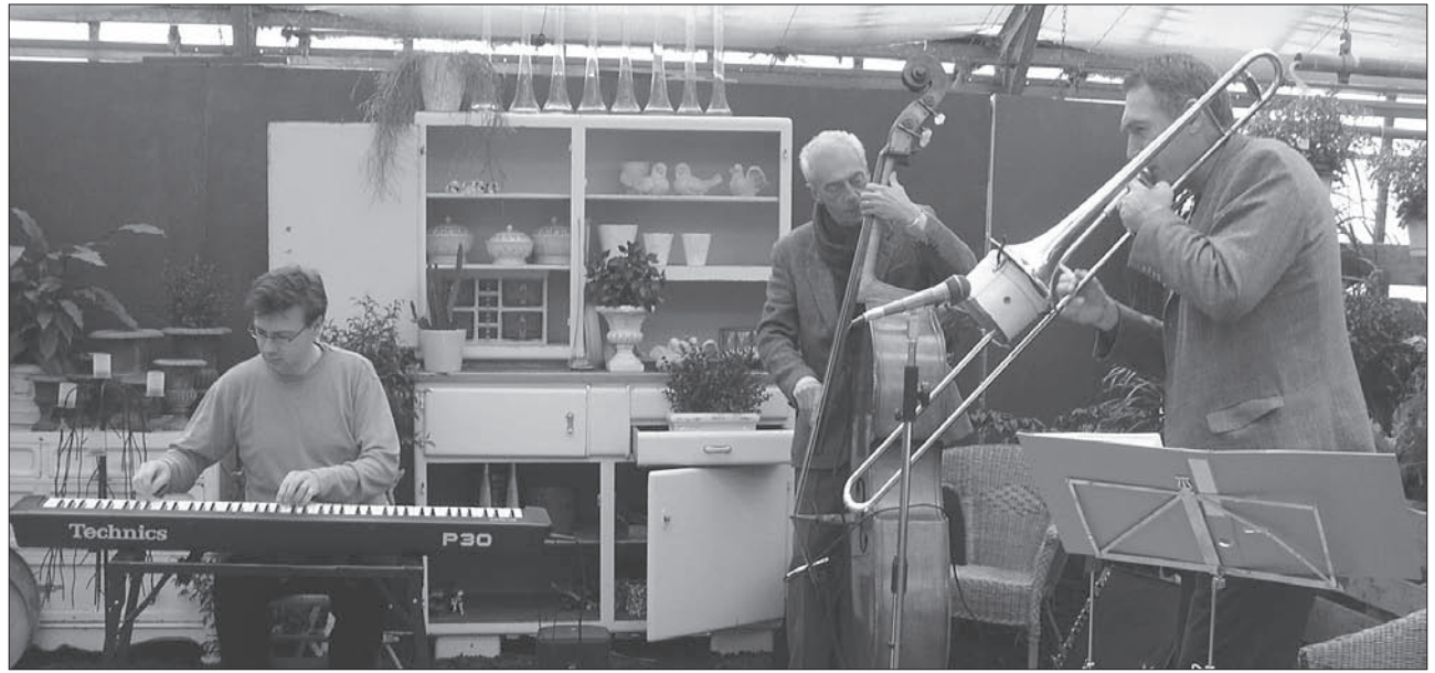
Der Jazz Circle Höngg während seiner Darbietung in der Gärtnerei Elliker.

Das eher unfreundliche Wetter war bald kein Thema mehr. Man schmiedete Pläne für einen schönen Sommer im Freien und befasste sich mit der Bepflanzung der Balkone, Terrassen oder Gärten. Fragen, wie: