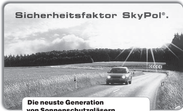
Die neueste Generation von Sonnenschutzgläsern