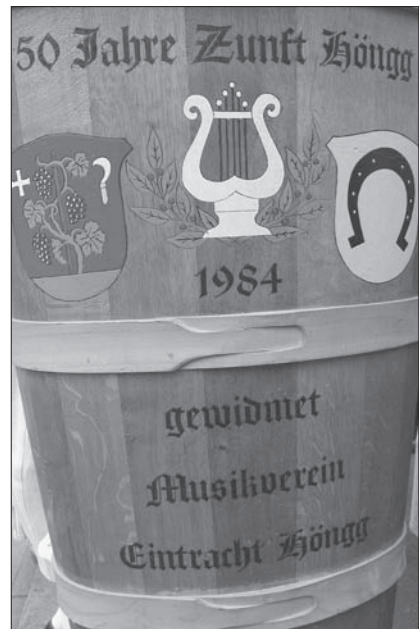
Quartiergemäss verzierte Tanne.