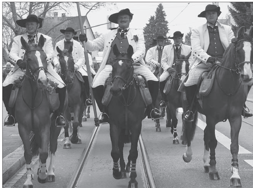
Die stolze Reitergruppe der Zunft Högger auf dem Weg zum «Schwert».