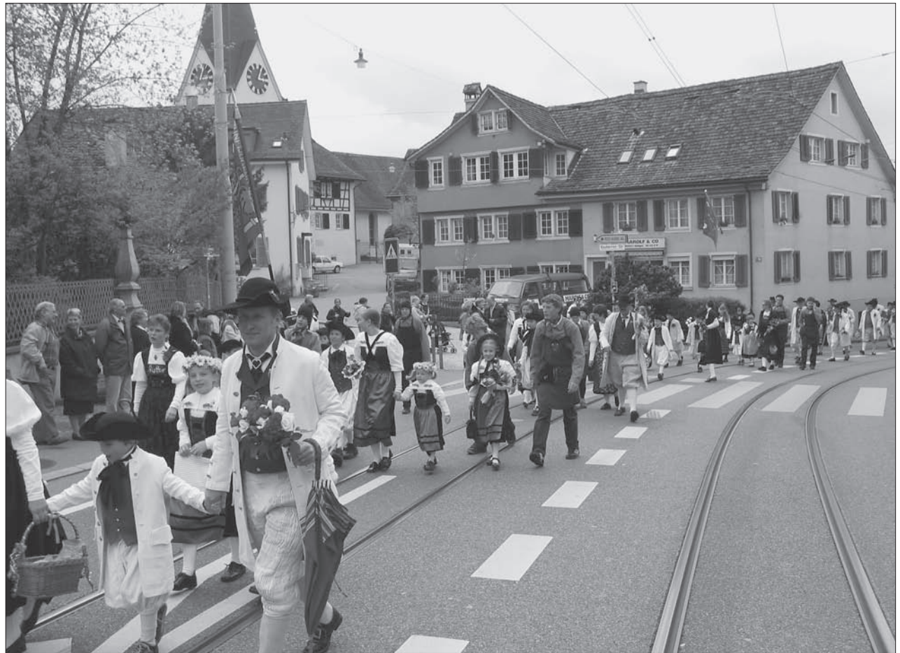
Rund 280 Personen marschierten am Sechseläutenmontag durch das Dorfzentrum.

Um die Zeit vor dem Abmarsch auf dem Zwielplatz etwas zu verkürzen, spielt der Musikverein Eintracht Högger einige zünftige Stücke. Viele Höggerinnen und Högger sind gekommen und erfreuen sich an der rassigen Musik und den umherspringenden Kindern, die sich in ihren wunderschönen, blumenverzierten Trachten anscheinend wohl fühlen. Wohin das Auge blickt, sind Blumen zu sehen. Als die Zünfter dann endlich aus der «Mülihalde» erscheinen, kommt Bewegung auf den Platz: Anwohner verschenken bereits die ersten Blumen, Kinder rennen zu ihren Vätern, Küsschen links, Küsschen