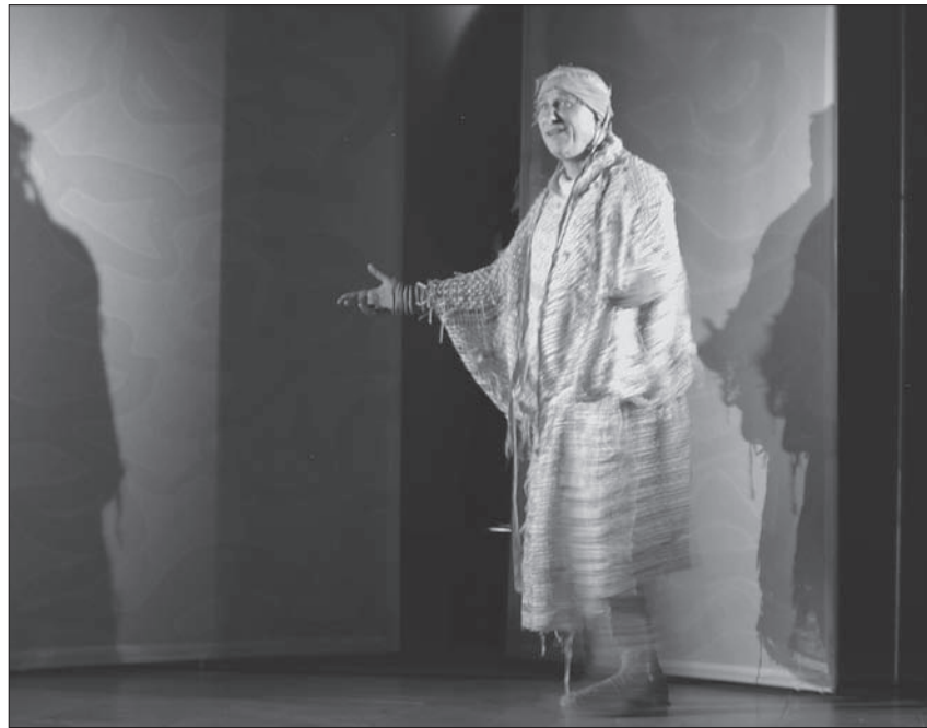
Mahalon trifft bei den Aufgeweckten ein.

Raum, Zeit und Ort sind aufgehoben. Die Ebenen der Bibel und die der Gegenwart vermischen sich im Jetzt. In sieben Szenen wird gezeigt, wie Aufgeweckte zweifeln, ob sie nicht mehr tot sind oder es nur so scheint.