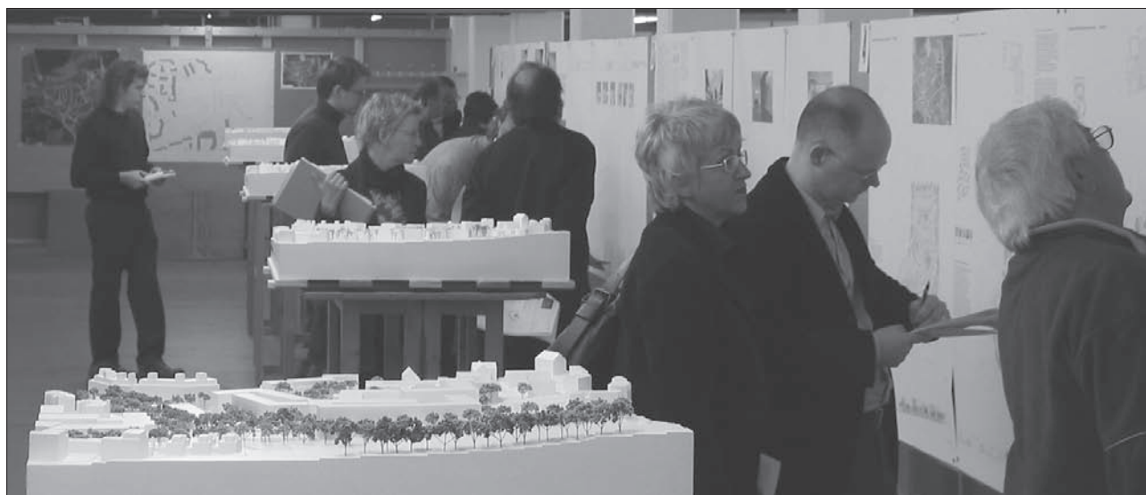
Die Sach- und Fachpreisrichter bei der Begutachtung der zwölf Projekte.

Dies gewährleiste, dass möglichst viele Aspekte der Vorschläge berücksichtigt werden und dass ein mög-