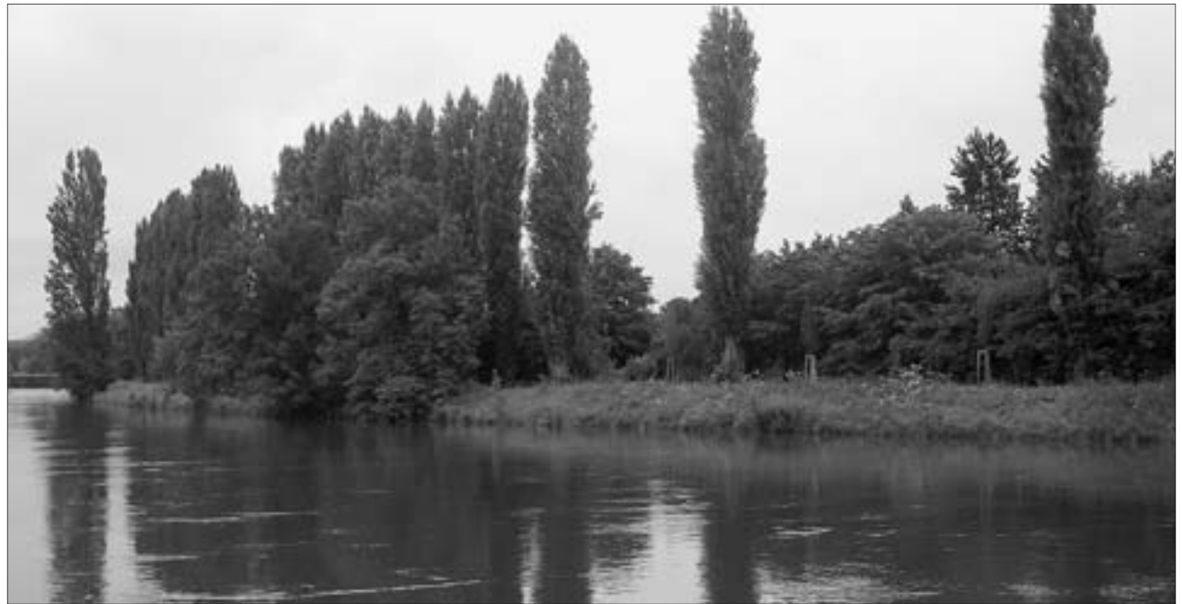
An dieser Flussstelle der Limmat ist ein treppenartiger Zugang zum Wasser geplant.

Limmatnahe Flächen werden gemäss Projekt zu flusstypischen Lebensräumen umgestaltet. Andere flussnahe Flächen sollen gestalterisch aufgewertet und somit zu öffentlich zugänglichen Aufenthaltsorten werden. Kiesige sowie treppenartig gestaltete Ufer sind vorgesehen, um der Bevölkerung Zugang zum Wasser zu verschaffen. Gehölze sollen rücker-versetzt oder lichter werden. Lösungen der Parkierungsprobleme in der Winzerhalde werden gesucht. Es wird angestrebt, dass das Limmatgebiet einfacher mit den öffentlichen Verkehrsmitteln zu erreichen ist. Um das Wegnetz für Fussgänger und Velofahrer attraktiver zu gestalten, sind Wegverbreiterungen vorgesehen. Als das LEK im Juni einem Teil der betroffenen Bevölkerungsgruppen vorgelegt wurde, stiess es teilweise