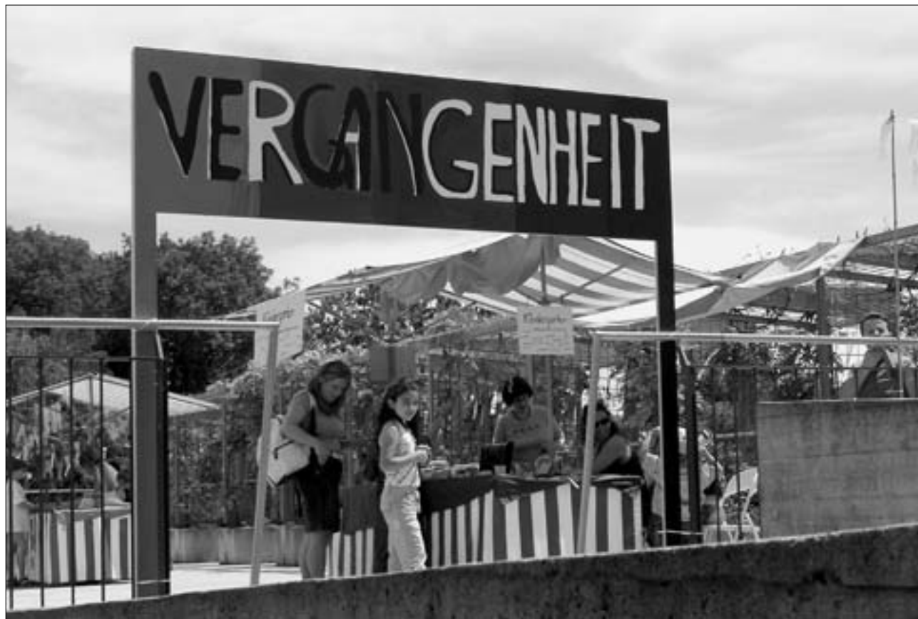
Das Tor in die Vergangenheit, selbst gebastelt von den Schülerinnen und Schülern des «Rütihofs».

Am Samstag, 26. Juni, putzte sich das Schulhaus zünftig heraus. Mit vielen farbigen Fähnlein und übergrossen Armbanduhren schmückte das Dekorationskomitee das ganze Schulhaus und sorgte so für die nötige Festlaune. Auf den beiden Turnhallendächern sah man sich in die Vergangenheit und in die Zukunft ver-