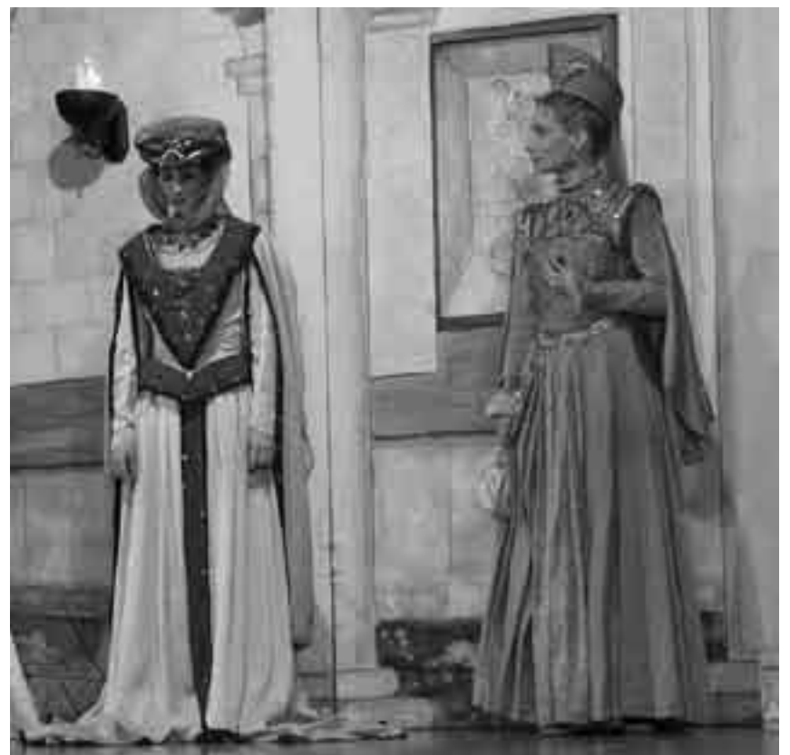
Die machtgerigen Schwestern Maruschkas, die Prinzessinnen Ludmilla und Clarissa, wollen die Thronfolge um jeden Preis.