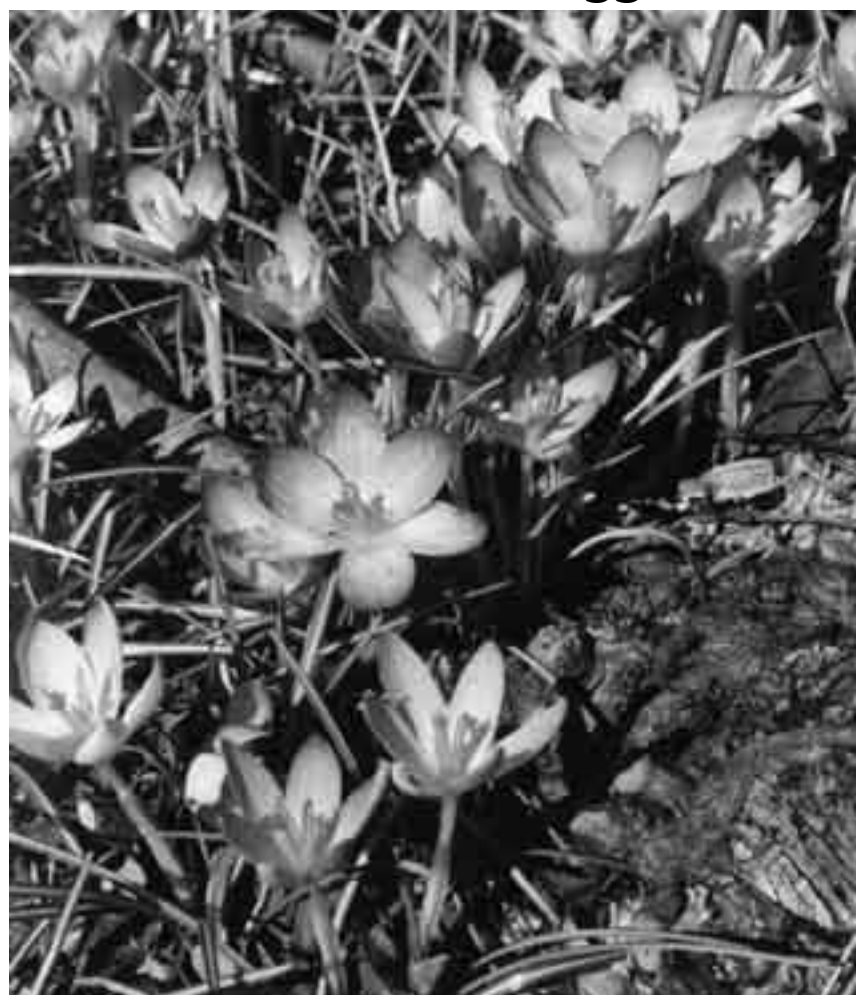
Bei welchem Höngger Schulhaus sind diese Krokus gleich tausendfach zu bewundern?

Abendgottesdienst für Junge und Junggebliebene am Sonntag, 7. März, um 19 Uhr in der ref. Kirche Höngg, mit der Worship-Band «online». Die Musiker zeigen im Jugendgottesdienst, wie sie das Gottesdienstthema musikalisch umsetzen. Mit Pfr. M. Fässler und Pfr. B. Amatruda.