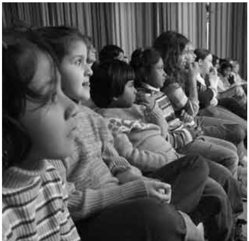
Gespannt verfolgen die Kinder die aufregende Geschichte von Prinzessin Maruschka und ihrem Salzprinzen.