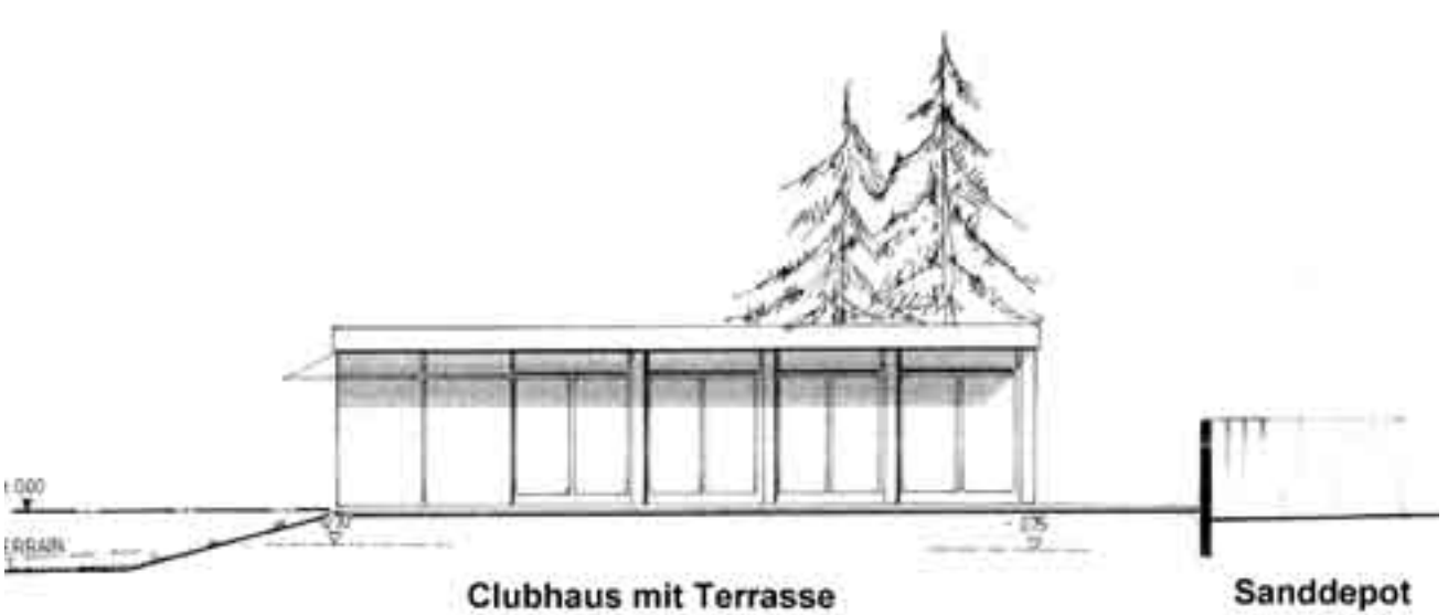
Frontansicht des geplanten Clubhauses des SV Höngg. In Zukunft sollen die Zuschauer die Spiele geschützt beobachten können.