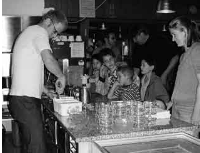
Ein junger Gastkoch bereitet den Kindern den Dessert zu.

Zurzeit werden die Freitagabende zwischen Frühlings- und Sommerferien besetzt. Wer möchte, darf sich aber auch schon für das zweite Halbjahr melden: Die Kulinarischen Freitagabende finden ausserhalb der Schulferien immer statt. Nähere Auskunft gibt's im GZ Wipkingen bei Stefan Wenger, unter Telefonnummer 01 276 82 83 (Dienstag bis Freitag) oder per E-Mail: gzwipkingen@gz-zh.ch (e)