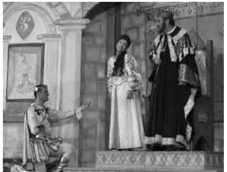
Der Salzprinz hält beim strengen König Jaromir um die Hand der schönen Maruschka an.

Viele Szenen wurden – zur Freude der Kinder – von den farbenfrohen Darstellern in Dialekt besungen. Anders als im «richtigen» Theater applaudierten die jungen Zuschauer nach jedem Auftritt begeistert. Die Schauspieler vergassen während des zweistündigen Stücks nie, die Kinder mit einzubeziehen. So mussten diese Prinzessin Maruschka versprechen, ihrem Vater nichts von ihrem heimlichen Verlobten, dem Salzprinzen, zu erzählen. Zudem halfen die kleinen Zuschauer der traurigen Prinzessin, ihren Prinzen zu finden, da dieser von seinem Vater, dem Salzkönig, in die Unterwelt verbannt wurde. Um ihren Liebsten zu finden, muss Maruschka jedoch einige schwierige Prüfungen bestehen und fest an ihre Liebe zum Salzprinzen glauben. Als das ver-