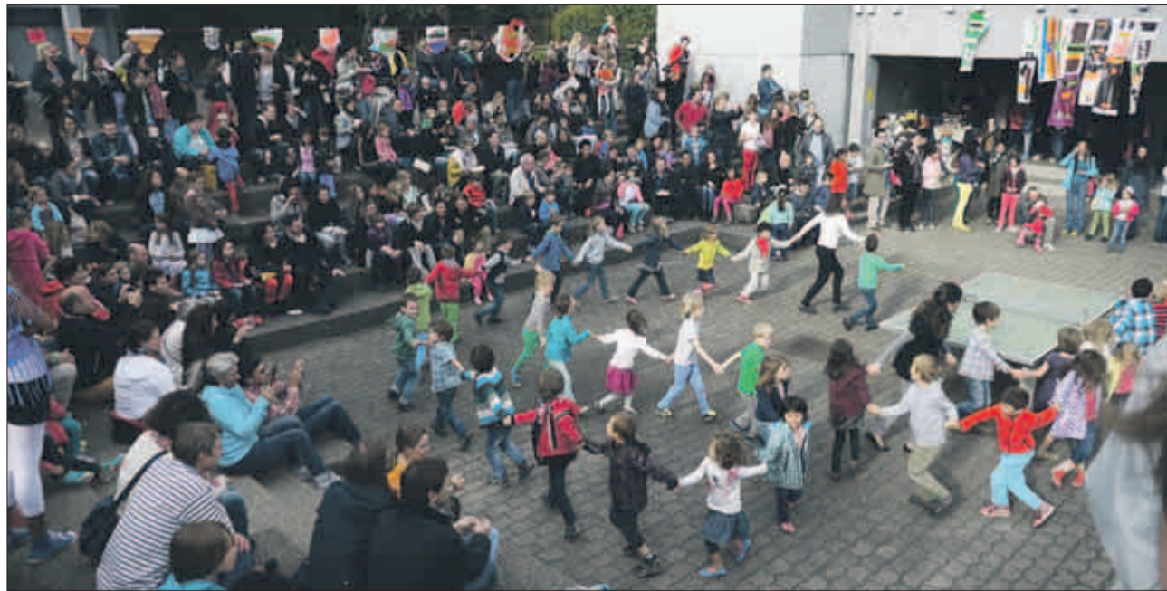
Auftritt der Kleinsten vor grosser Kulisse am Sommerfest des Schulhauses Vogtsrain.

Zu den weiteren Höhepunkten gehörten die Darbietungen der verschiedenen Klassen: Die Kindergärten zeigten lebendige Volkstänze, die Zweitklässler bewegten sich zu spa-