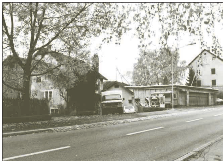
Die neue historische Aufnahme entstand an einem Ort, an dem in diesen Tagen bereits wieder gebaut wird.

Damals – und dies ist eigentlich gar nicht so lange her – ging es an dieser Stelle radikal zur Sache, was ei-