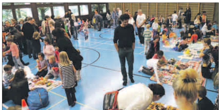
Ausnahmsweise in der Turnhalle: Am Flohmarkt wurde angepriesen und gefeilscht.

Jetzt in der Bildgalerie auf www.hoengger.ch : Bildstrecke vom Sommerfest