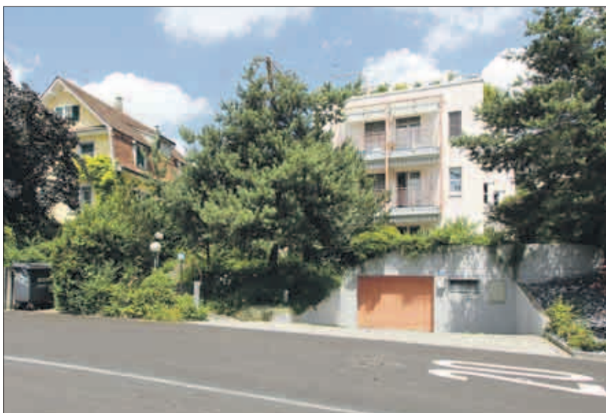
Das Foto letzter Woche in dieser Serie entstand an der Brunnenstrasse 62.

Die Häuser mit derselben Bauweise entstanden alle 1909. Das abgebildete musste 1989 einem Neubau