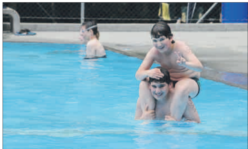
Spiel und Spass zwischendurch.

Die Leiter hatten vor dem Wettkampfstart noch einiges Administratives zu erledigen, wie etwa Brevetausweise abgeben, Teamleitersitzung besuchen oder Teamnummern in Erfahrung bringen. Als es losging, startete die Sektion Höngg gut in den Wettkampf. Weil das Wetter sonnig war, waren die kühlen Wassertemperaturen erträglich.