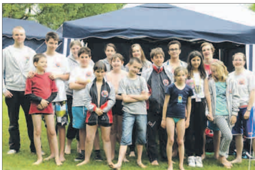
Die Höngger Rettungsschwimmer-Jugend an der Schweizer-Meisterschaft.

Nach der letzten Disziplin des Tages begaben sich alle mit ihrem Gepäck in die ihnen für die Nacht zugewiesene Turnhalle und anschliessend in die Festhalle. Die Sektion Höngg schaffte es jeweils, einen der Shuttlebusse zu erwischen. Weil es davon jedoch zu wenige hatte, mussten viele Teilnehmer zu Fuss gehen. Das Abendprogramm war dann aber gut organisiert und die Kinder hatten sichtlich Spass an den Spielen und der Disco. Um 22 Uhr brachten es die Höngger Leiter trotzdem fertig, auch die letzten ihrer Jugendlichen zur Rückkehr in die Unterkunft zu bewegen. Da von den JSM-Organisatoren keine Lichtlöschzeit festgelegt worden war, dauerte es eine Weile, bis die verschiedenen Sektionen dies untereinander geklärt hatten.