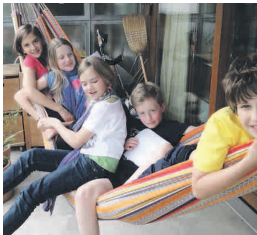
Auch Entspannung musste zwischendurch sein.

Das Team war schnell gefunden. Schliesslich fand sich doch schnell ein Team interessierter Schülerinnen und Schüler zusammen. Und nun begann die Arbeit: das Schreiben! Oder besser gesagt, erst einmal überlegen. Die Jungs dachten eher an eine wilde Geschichte mit FBI und möglichst viel Action – nach einigen Diskussionen entstand dann aber schliesslich «Le voleur de Paris, das iPhone und die 5», eine spannende Geschichte um eine Gruppe Sprachschülerinnen. Der Diebstahl eines Handys führt zu einer Tour durch Paris, bevor es zum Showdown mit der Polizei in der Kathedrale Notre-Dame kommt. Einige von uns waren schon mal in Paris, daher konnten wir uns die Atmosphäre in Notre-Dame richtig gut vorstellen. Eine Geschichte mit Spannung, Humor und ein wenig Flirten – zum Schluss waren alle Drehbuchautorin-