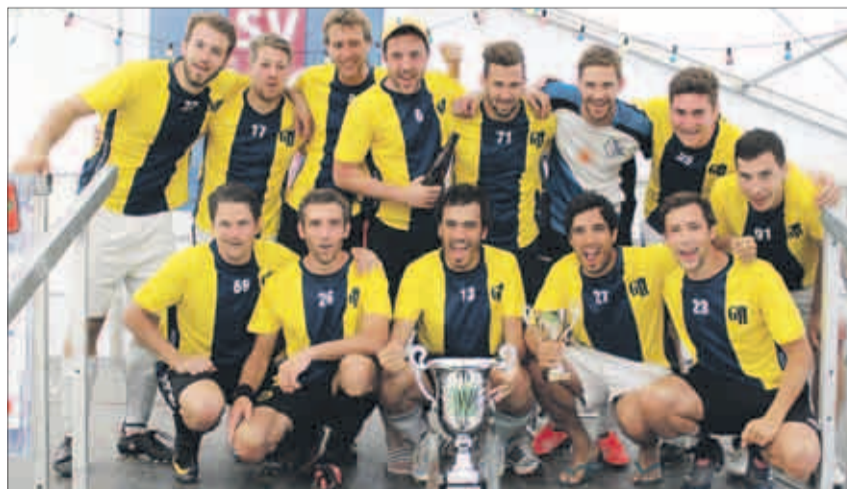
Sie gewannen den Martin-Cup: Die Spieler des Teams Gebrüder Hossa freuen sich sichtlich.

Jetzt in der Bildgalerie auf www.hoengger.ch: Bildstrecke vom Martin-Cup