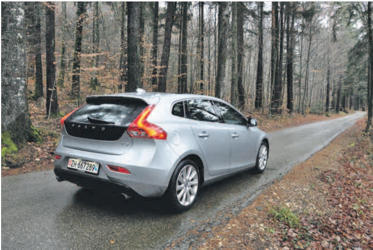
Der Volvo V40 T3 Summum wird in der Kompaktklasse «Rad fassen».